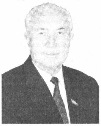
Наука Узбекистана понесла тяжелую утрату.