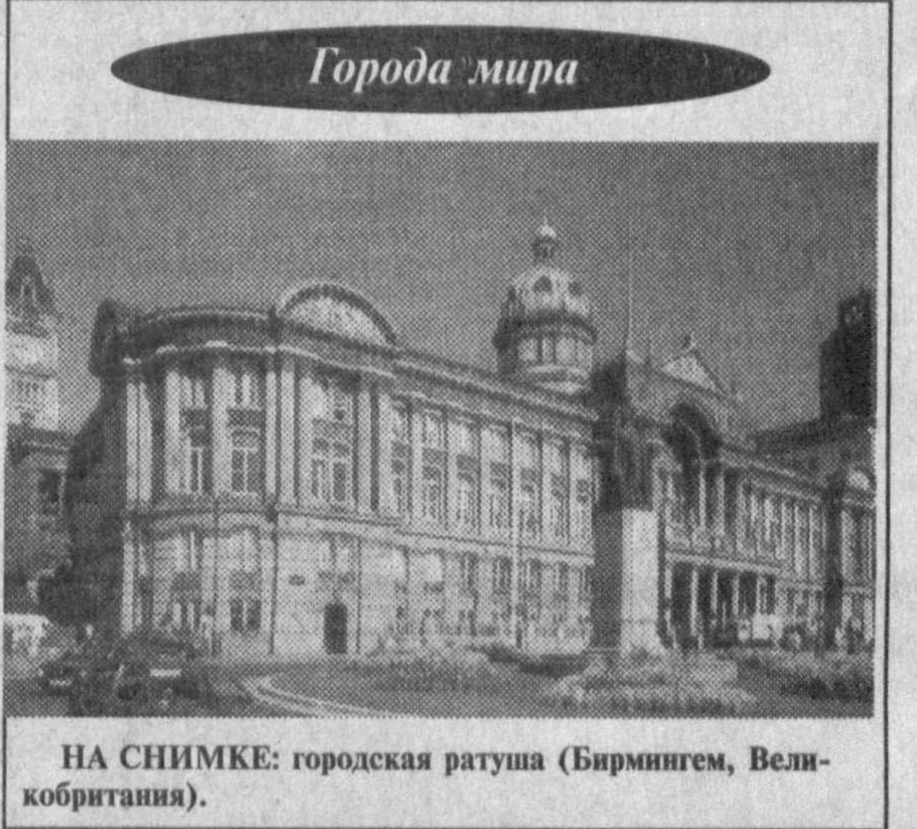
НА СНИМКЕ: городская ратуша (Бирмингем, Великобритания).