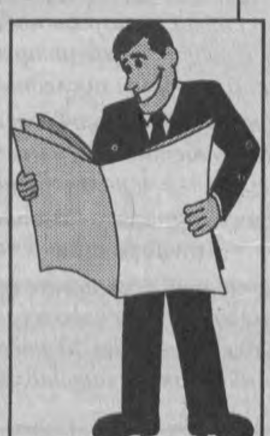
"Это путь к успеху"

Новая программа Национального Банка по оказанию технической и финансовой поддержки малому и среднему бизнесу