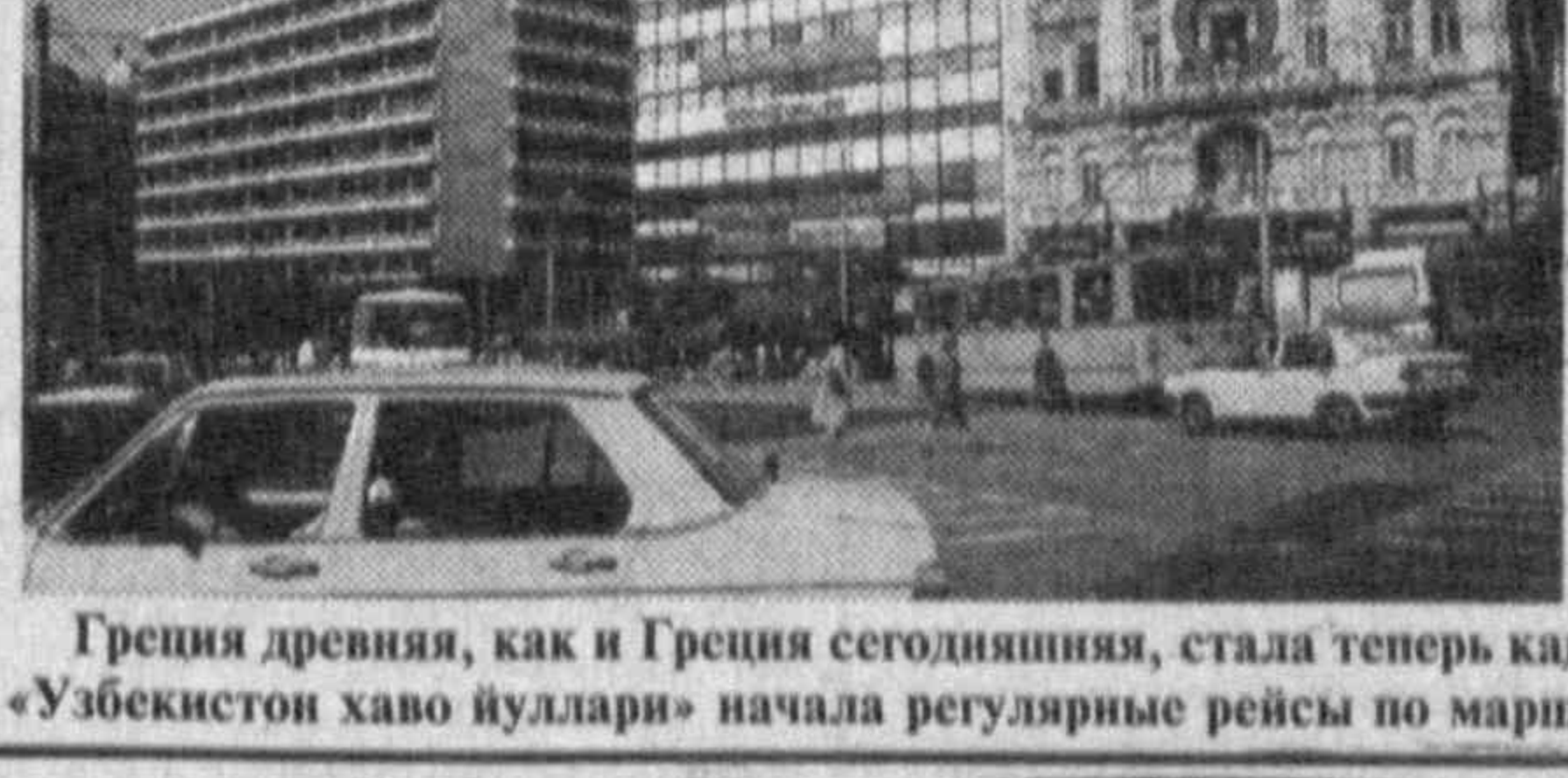
Греция древняя, как и Греция сегодняшняя, стала теперь как бы ближе к нам: авиакомпания «Узбекистон хаво йуллари» начала регулярные рейсы по маршруту Ташкент — Афины.