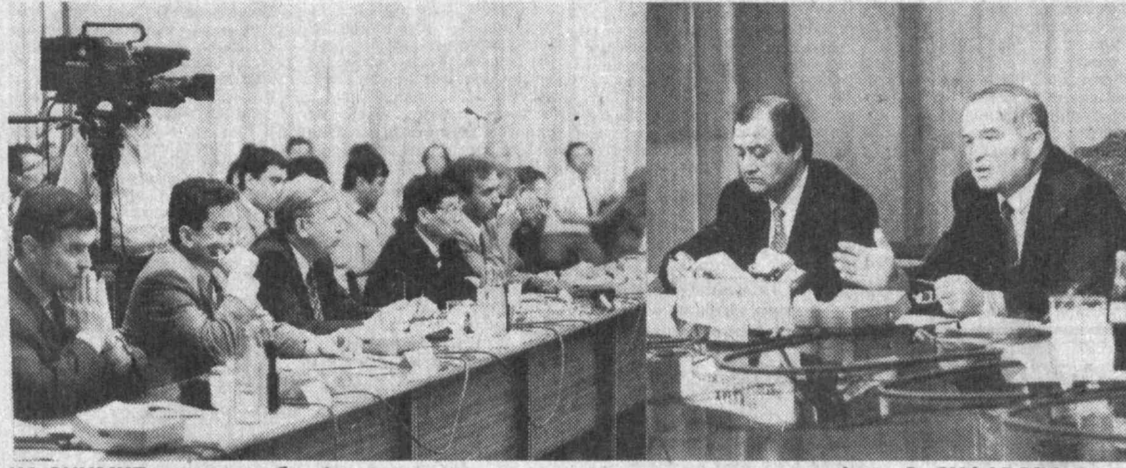
НА СНИМКЕ: во время брифинга.