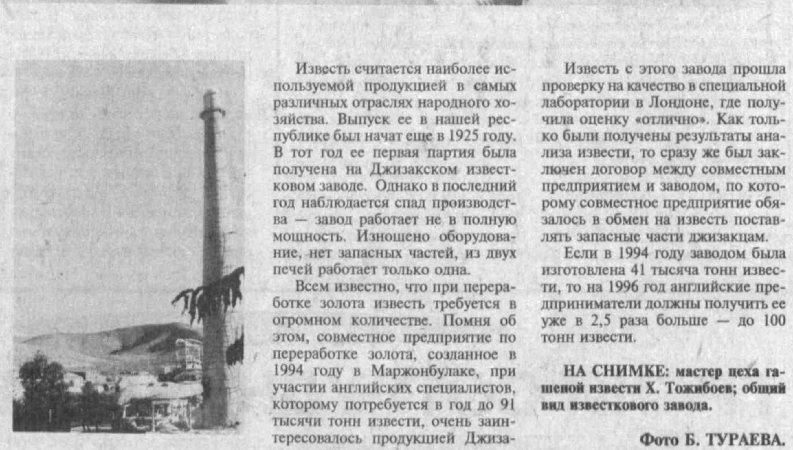
ИЗВЕЩЬ СЧИТАЕТСЯ НАИБОЛЕЕ ИСПОЛЗУЕМОЙ ПРОДУКЦИЕЙ В САМЫХ РАЗЛИЧНЫХ ОТРАСЛЯХ НАРОДНОГО ХОЗЯЙСТВА. ВЫПУСК ЕЕ В НАШЕЙ РЕСПУБЛИКЕ НАЧАЛ ЕЩЕ В 1925 ГОДУ. В ТОТ ГОД ЕЕ ПЕРВАЯ ПАРТИЯ БЫЛА ПОЛУЧЕНА НА ДЖИЗЯКСКОМ ИЗВЕЩЬНОМ ЗАВОДЕ. ОДНАКО В ПОСЛЕДНИЙ ГОД НАБЛЮДАЕТСЯ СПАД ПРОИЗ- ВОДСТВА — ЗАВОД РАБОТАЕТ НЕ В ПОЛНУЮ МОЩНОСТЬ. ИЗНОШЕНО ОБОРУДОВАНИЕ, НЕТ ЗАПАСНЫХ ЧАСТЕЙ, ИЗ ДВУХ ПЕЧЕЙ РАБОТАЕТ ТОЛЬКО ОДНА.