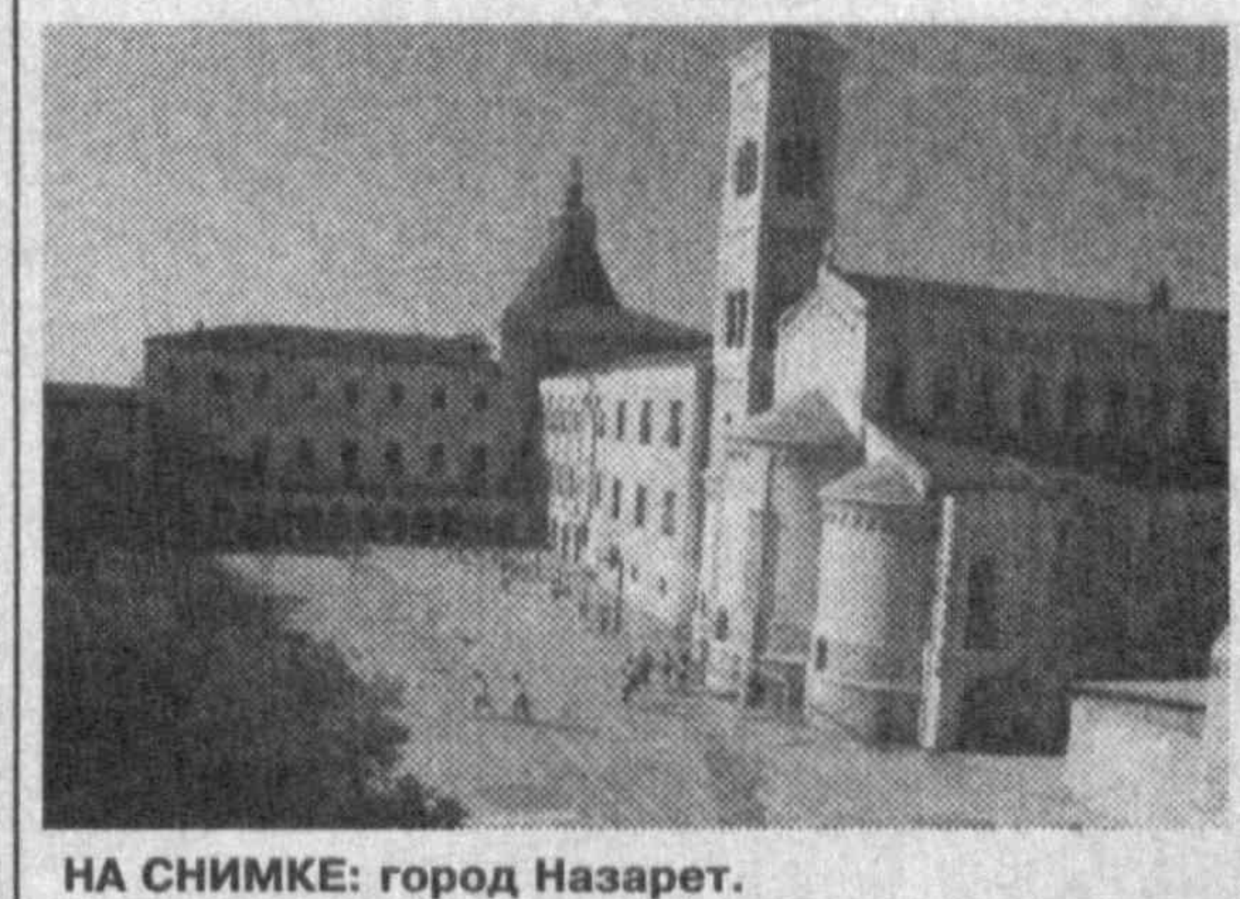
НА СНИМКЕ: город Назарет.