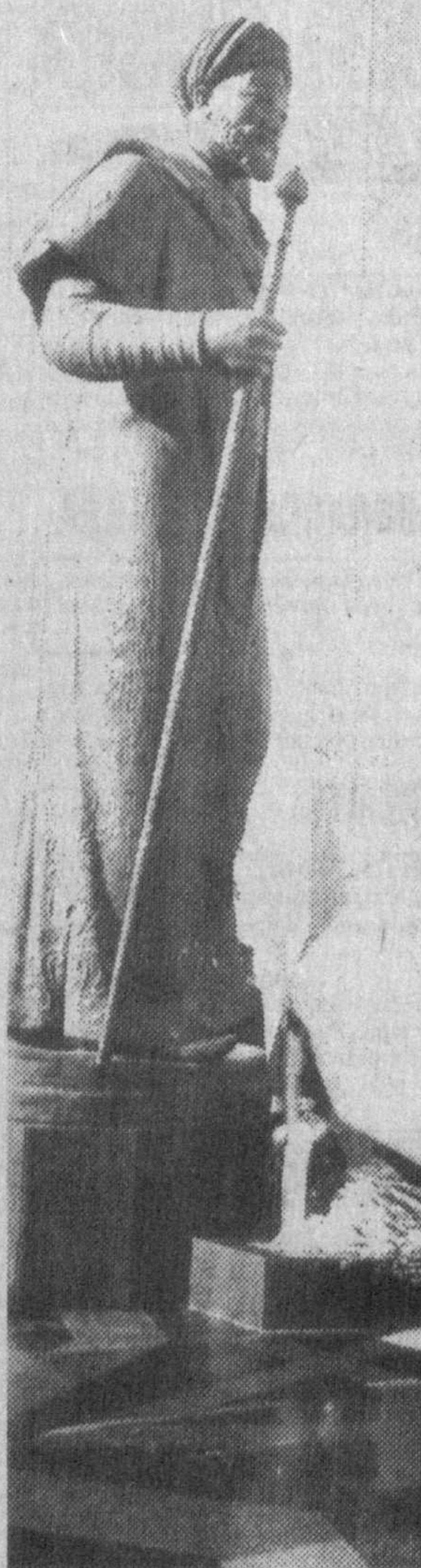
Передо избранный им тахалусе, литературный псевдоним, переводит так: «некая мелодия», «мелодичный», что по мнению навоиведов является упрощением.

555 лет назад он пришел в мир. Автор гениальных поэтических творений, серьезных научных исследований, летописец многих событий, видный государственный деятель своей эпохи.