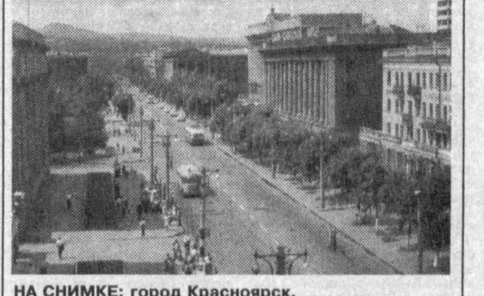
НА СНИМКЕ: город Красноярск.