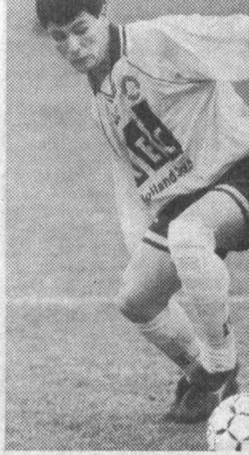
С. СЕРГЕЕВ.