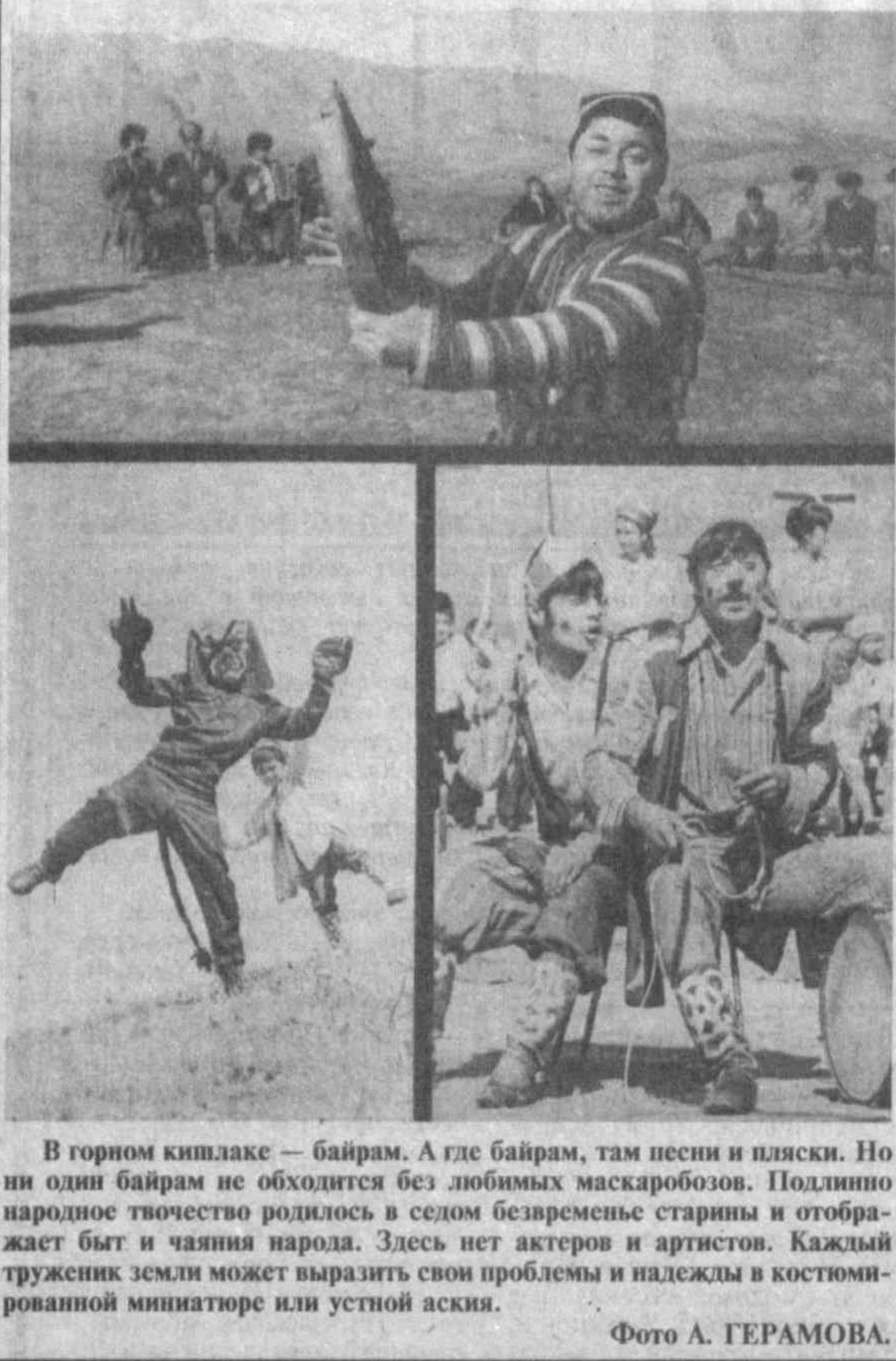
В горном кивлаке — байрам. А где байрам, там песни и пляски. Но ни один байрам не обходится без любимых маскаробов.