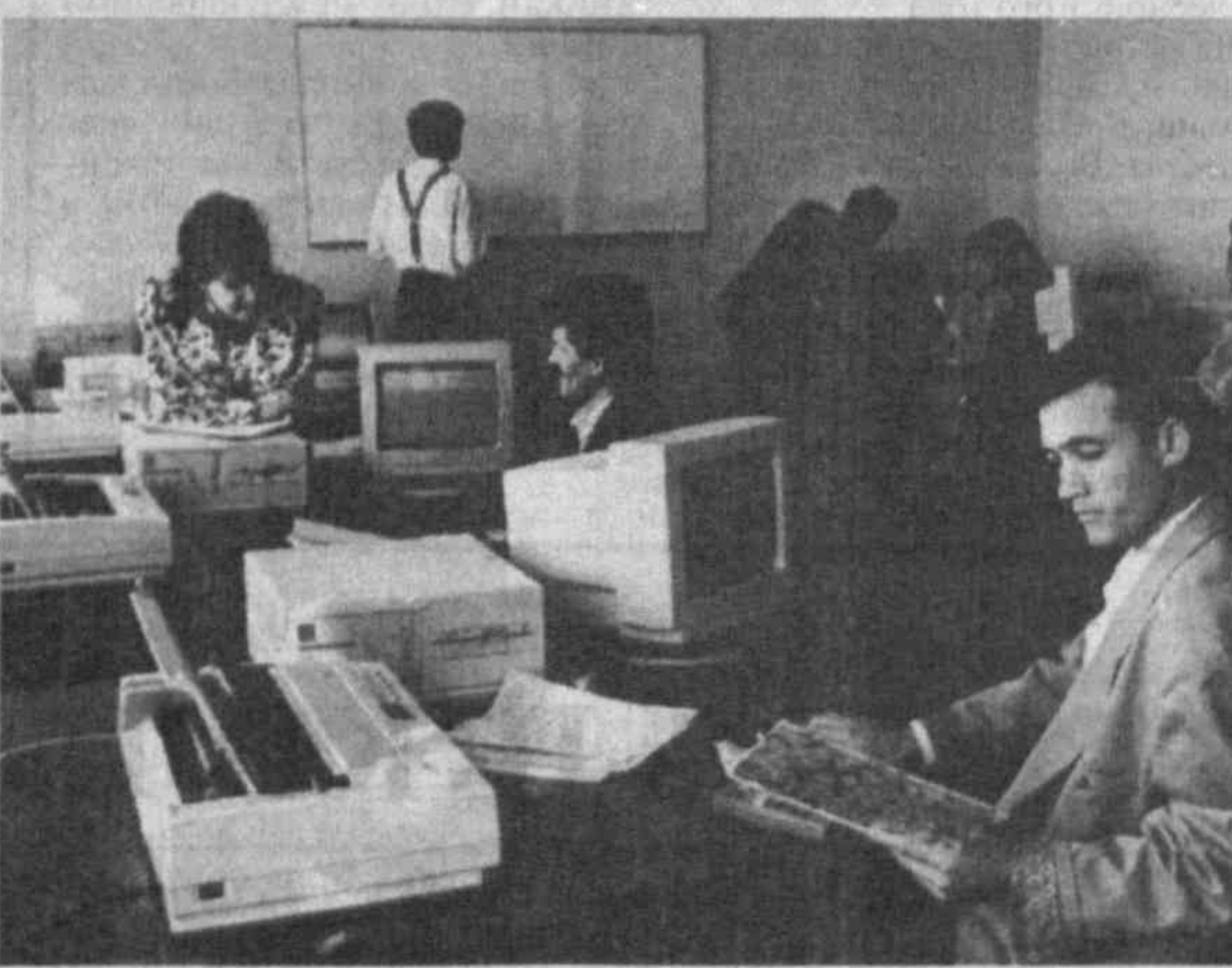
НА СНИМКАХ: общий вид Академии государственного и общественного строительства; в компьютерном центре.