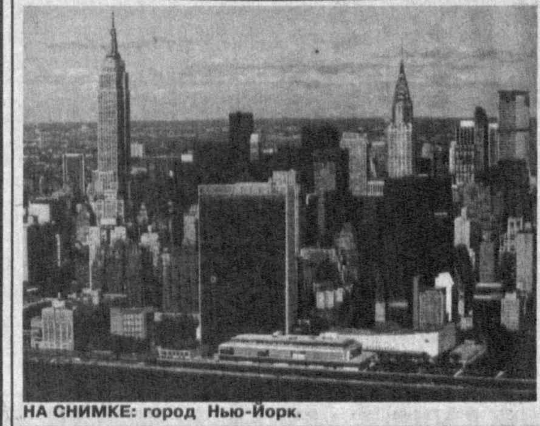
НА СНИМКЕ: город Нью-Йорк.