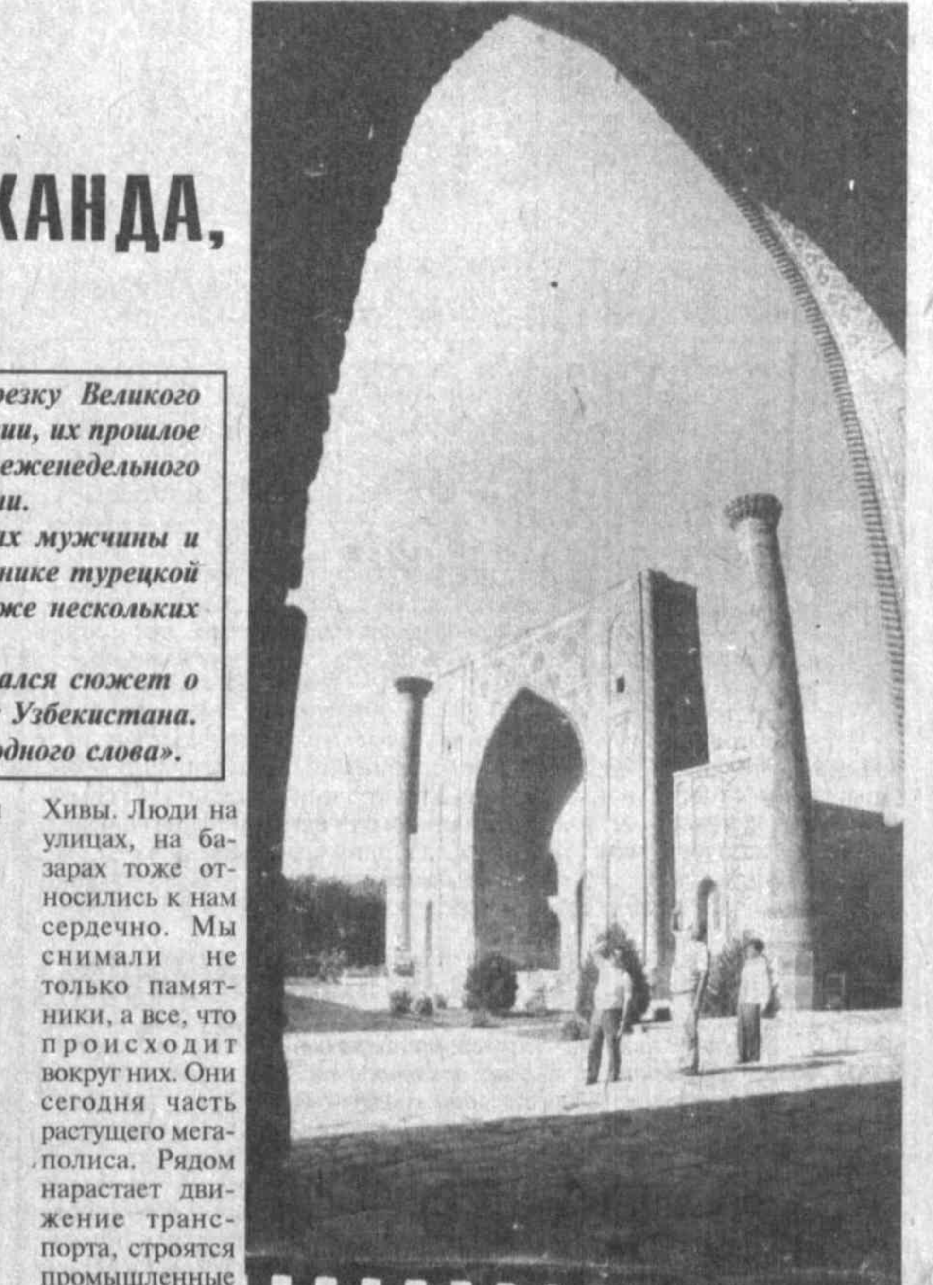
НА СНИМКЕ: в объективе телекамеры — архитектурные шедевры Самарканда.