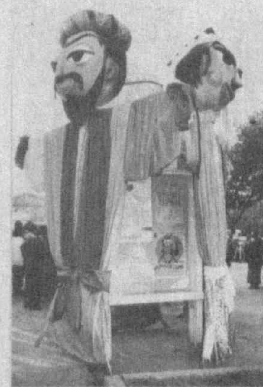
куколников положительно отражается на процессах творческой деятельности казахстанцев. Достаточно привести в пример красноречивый факт: Казахстан был на фестивале представлен гостями из Алматы, Актобинска, Кызылкия и Шымкента. Профессионалам есть о чем поговорить на жи-

Нарядно украшена площадь перед Республиканским театром кукол, поднят флаг фестиваля. На площадке этого театра каждый день идут спектакли. И всего в течение фестиваля зрители увидят 26 постановок.