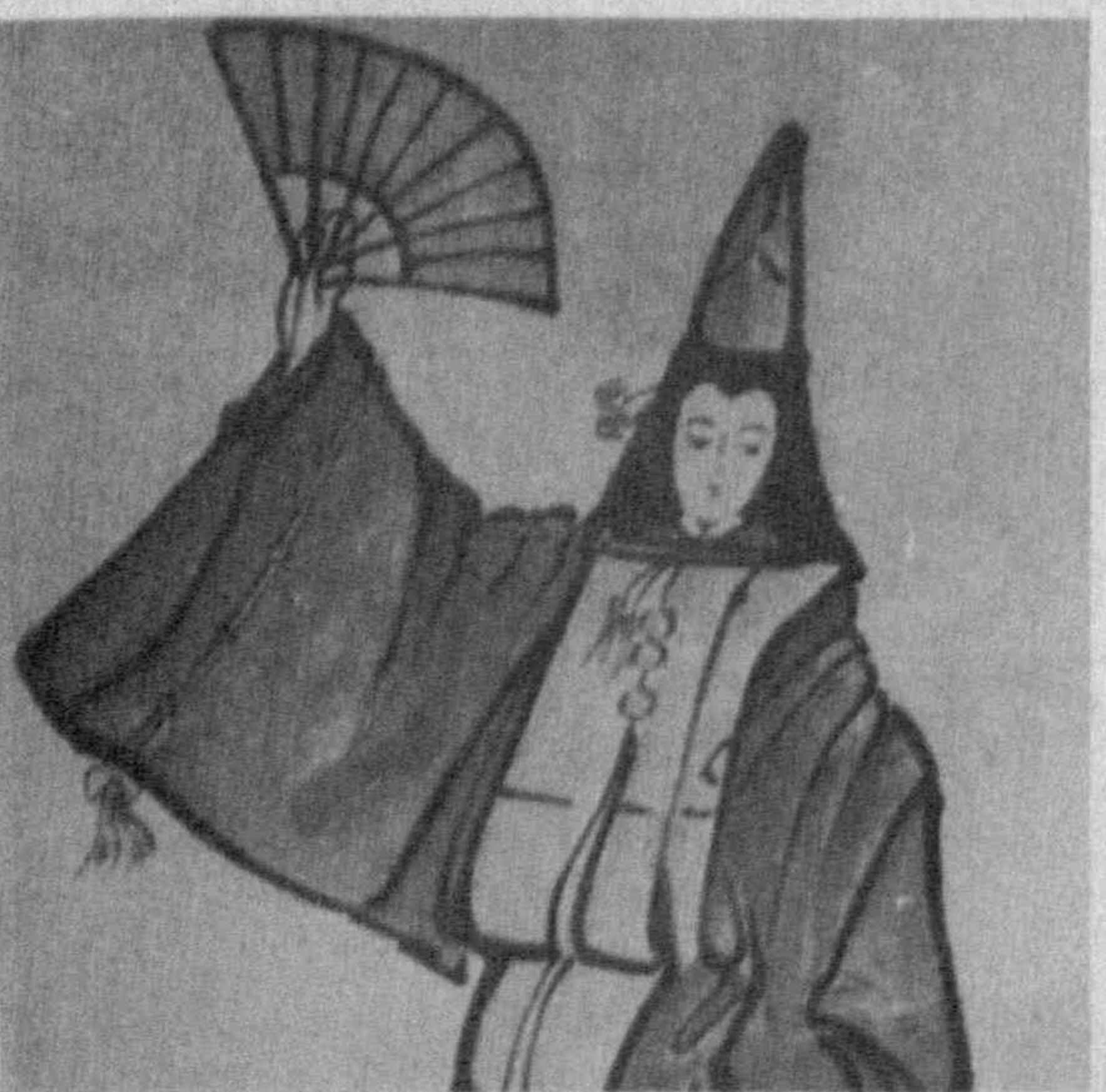
В Центральном выставочном зале Союза художников Узбекистана вниманию любителей живописи представлены лучшие работы графиков Японии.