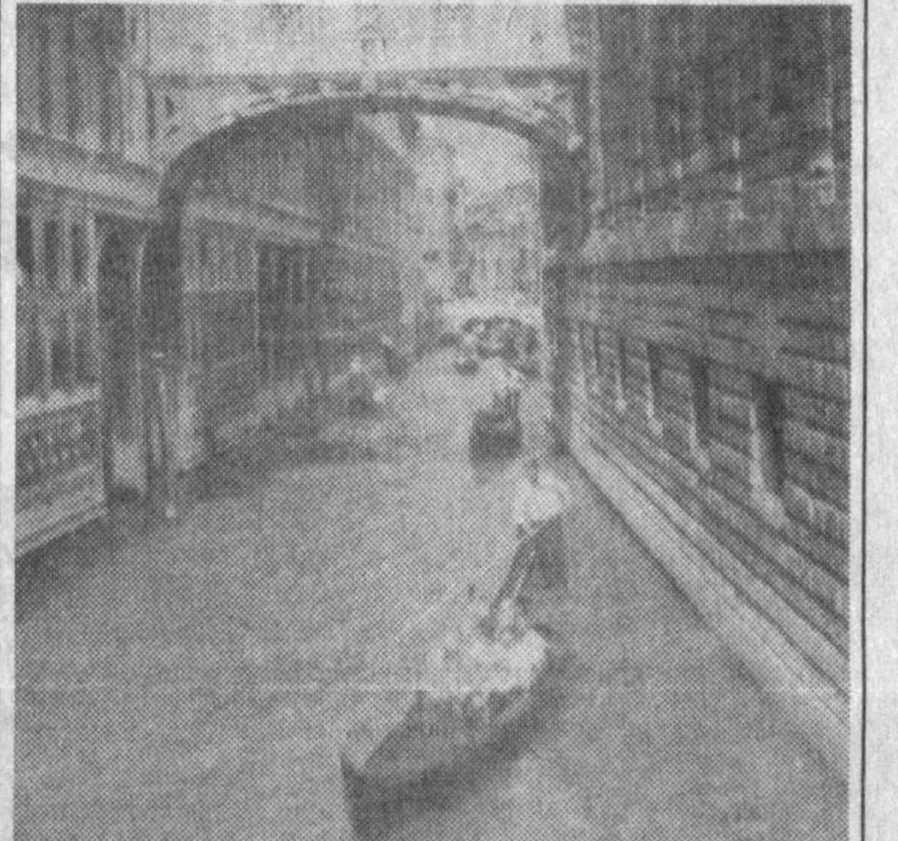
НА СНИМКЕ: Венеция — город каналов и мостов, знаменитый «Мост вздохов».