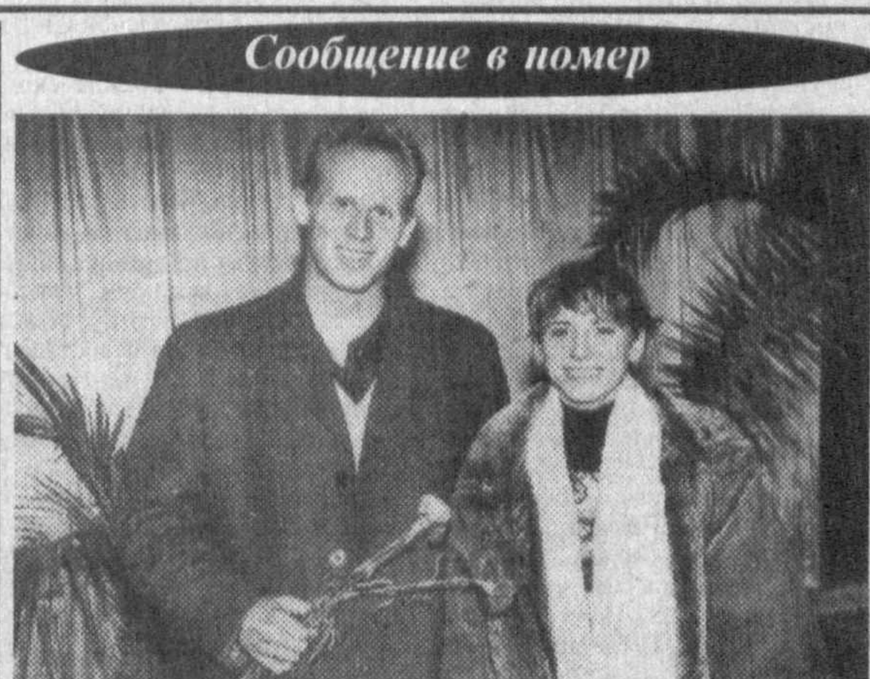
Сообщение в номер

На совещании намечены меры, направленные на решение этой и других проблем.