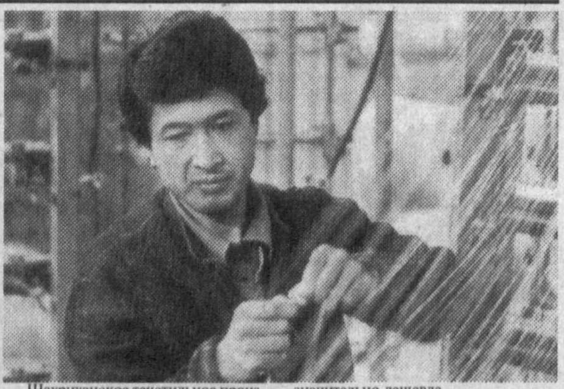
Шахриханское текстильное производственное акционерное объединение открытого типа — одно из крупнейших предприятий системы государственной корпорации «Махаллий санат». Здесь производят, в основном, атлас и шелковые ткани.

С 1995 году у нас действует система оказания помощи индивидуальным застройщикам. Словом, мы, действуя в рамках существующих законов, последовательно проводим социальную политику. Наш принцип: не человек служит реформам, а реформы должны служить человеку. Беседу вел Темур ЭШБАЕВ.