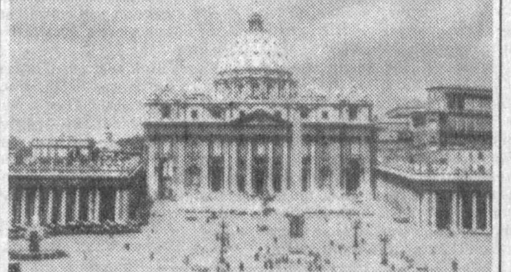
НА СНИМКЕ: собор св. Петра — крупнейший католический храм (Ватикан), в его строительстве принимали участие великие итальянские зодчие.