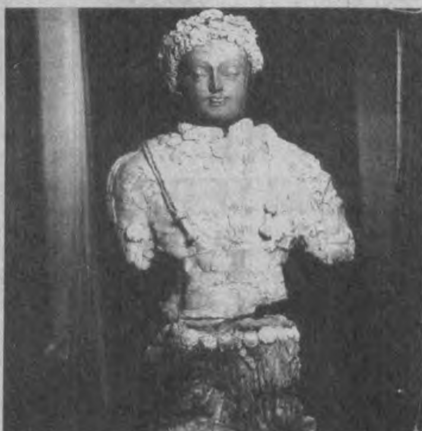
Скульптуры, высеченные в те времена, красноречиво свидетельствуют о том, кому поклонялись наши древние предки...

На рубеже новой эры территория нынешнего Узбекистана, да и вся Центральная Азия были местом интенсивного посева и расцвета многих культур. Бактрия, Маргиана, Кушанское царство, Парфия, Согд. О высоком уровне цивилизации домухамеданского периода говорят многочисленные находки древней культуры, бытовых и ритуальных предметов, которые обнаруживают современные археологи. Впечатляют скульптуры, найденные на месте крупного бактрийского города в урочище Халчаян у побережья реки Сурхандарья. Здесь располагался дворец первых кушан из рода царя Герая, чеканившего свои монеты в I веке до н. э.