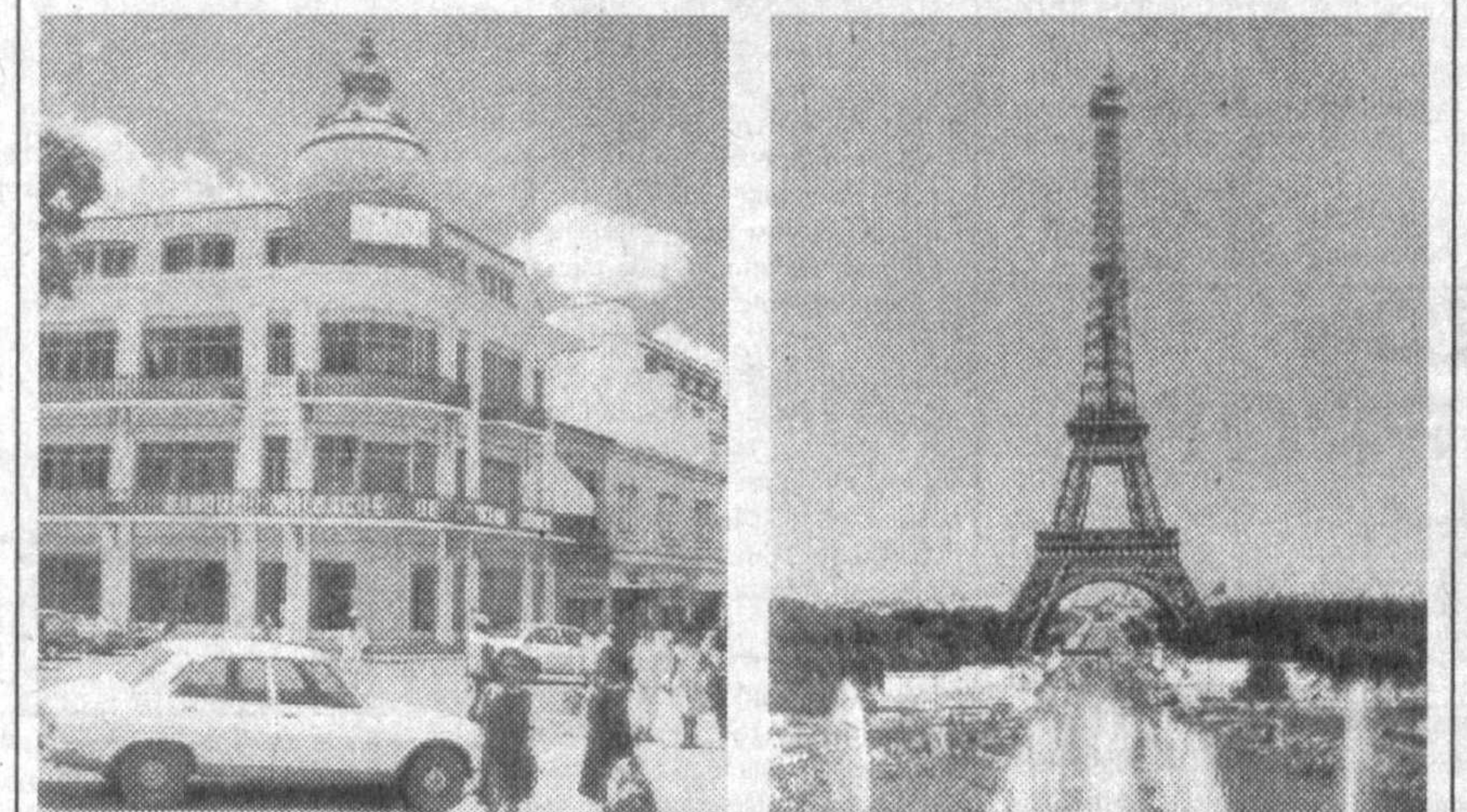
НА СНИМКЕ: г. Антананариву (о. Мадагаскар); Эйфелева башня.

По его словам, открытие было сделано специалистами из Непала, Индии, Пакистана, Шри-Ланки и Японии. Место расположено в храме города Ламбинга к югу-западу от столицы Катманду.