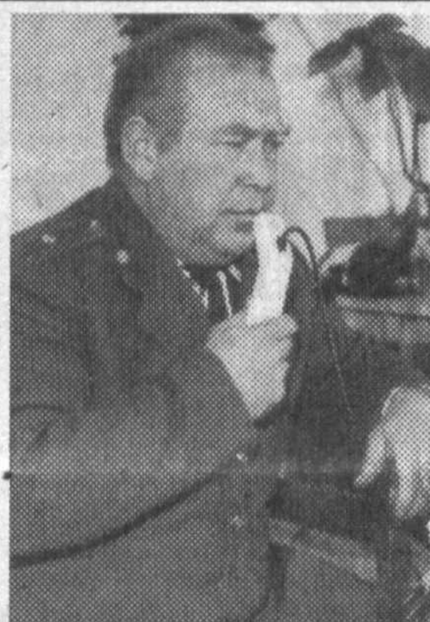
В снег, в мороз, под проливным дождем и палящим солнцем эти люди всегда на посту. Они предельно собраны, бдительны, корректны, четко знают, что на них лежит ответственность за порядок на дорогах, за жизнь людей.

В результате около двух тысяч учащихся 11 классов общеобразовательных школ только Ташкента и столичной области немало повзрослели за время тестовых испытаний.