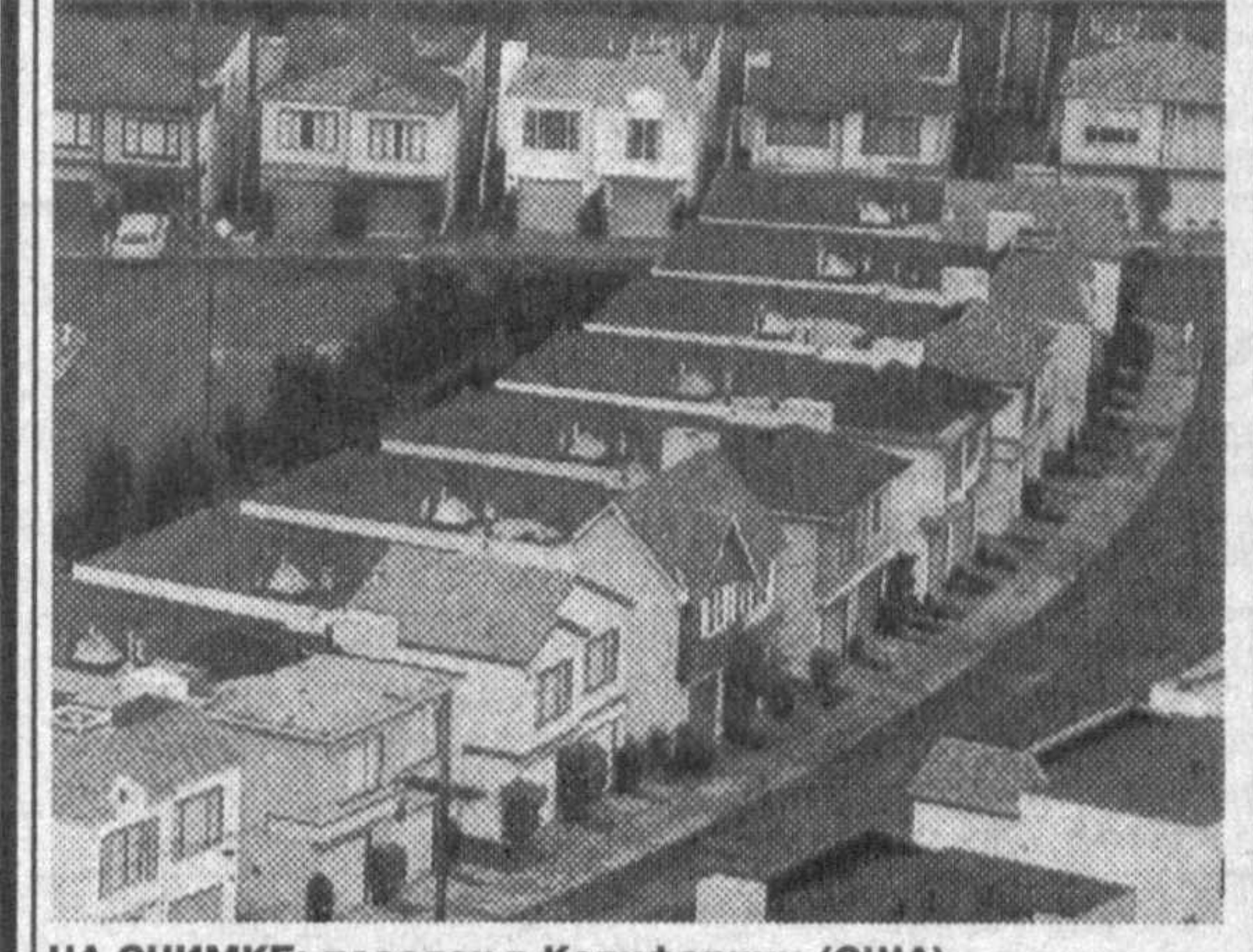
НА СНИМКЕ: поселок в Калифорнии (США).