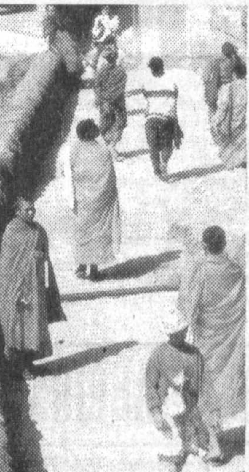
Как ни парадоксально, но чтобы преодолеть около двух тысяч километров, разделяющих Ташкент и Дели, требуется столько же времени, сколько и на то, чтобы проехать 59 километров, разделяющие пещеры Аджанты и ближайший к ним город — Багдана.