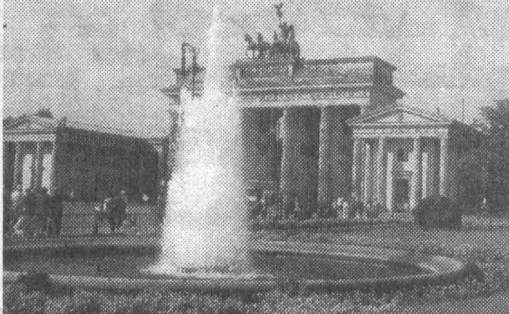
г. Берлин. Бранденбургские ворота.