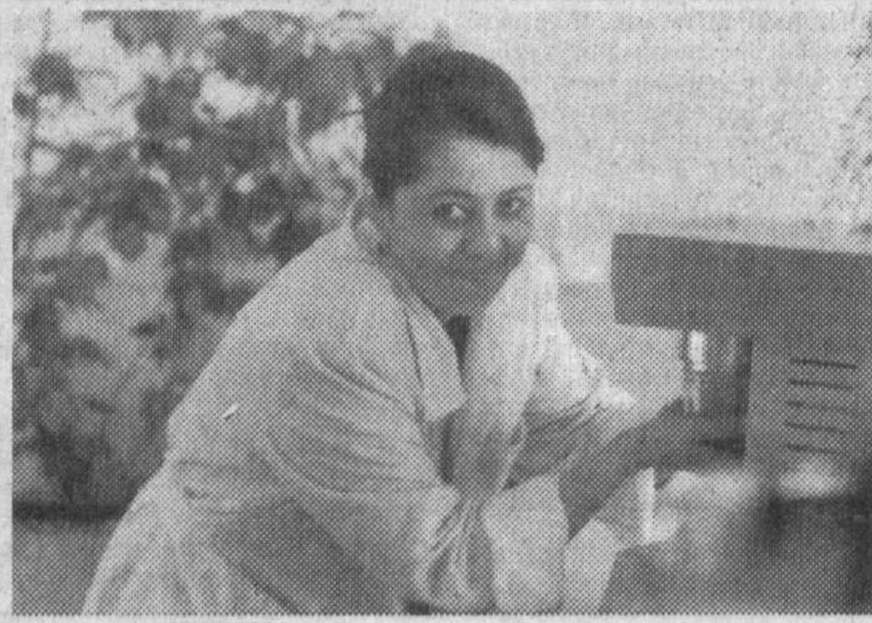
110 миллионов сумов — такова прибыль, полученная Ханкинским мелькомбинатом, что в Хорезмской области, в прошлом году. Это результат стабильной, четко отлаженной работы всех членов коллектива, которые недавно стали акционерами собственного предприятия.

Намало обид высказали торгующие на рынке дехкане и в адрес работников базаров. Лучшие места они отводят постоянным перекупщикам.