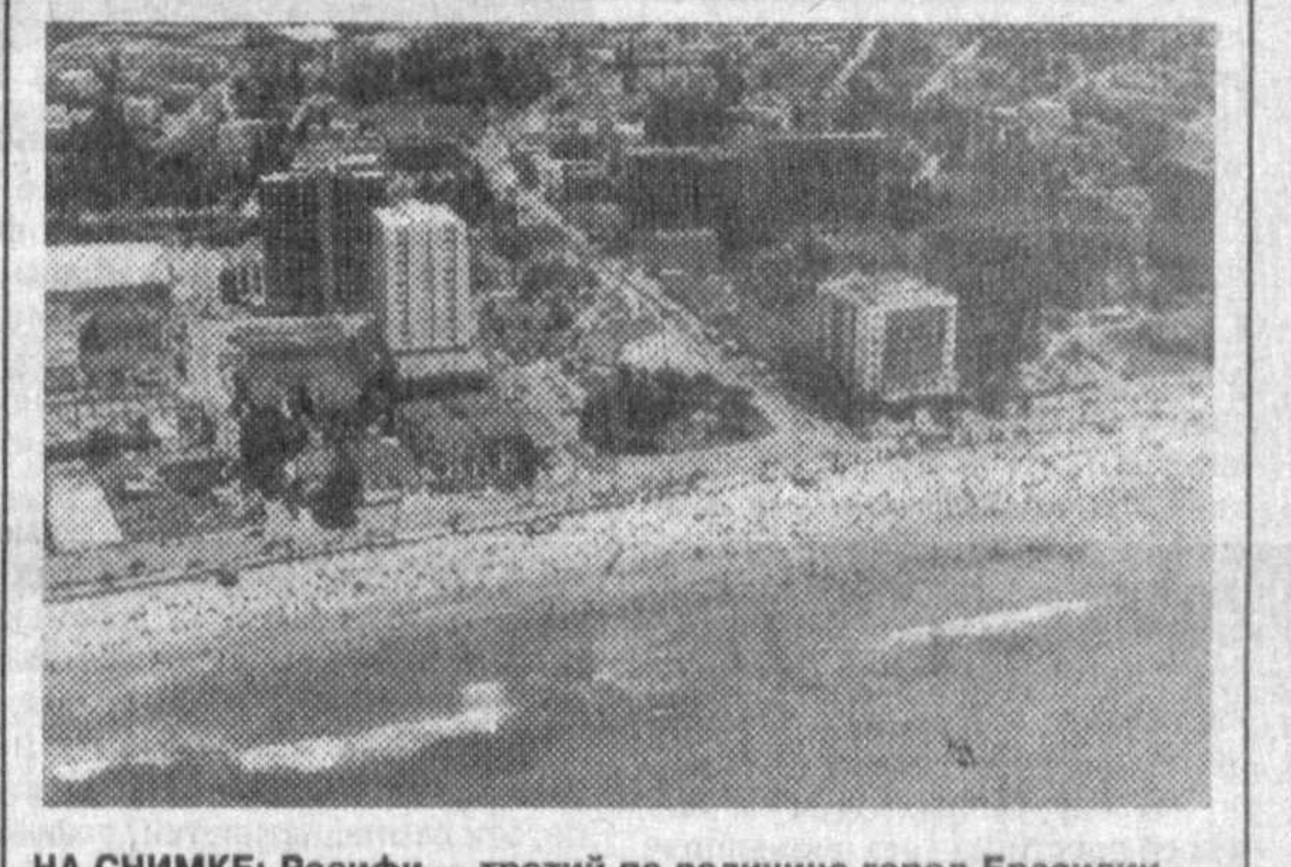
НА СНИМКЕ: Ресифи — третий по величине город Бразилии.