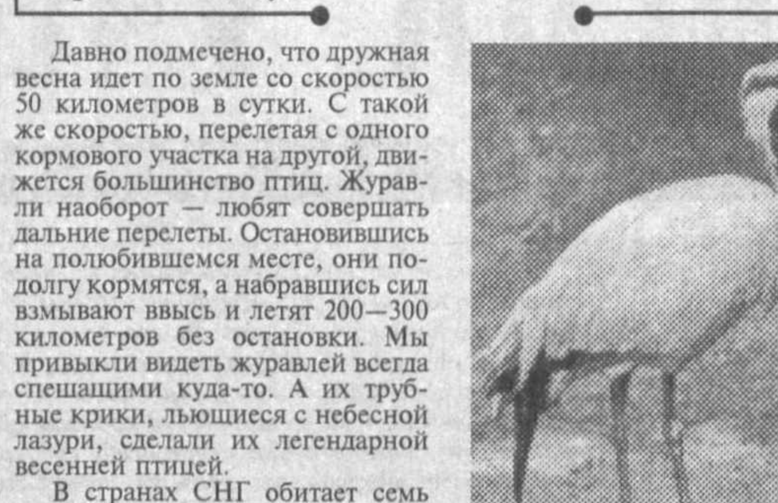
Давно подмечено, что дружная весна идет по земле со скоростью 50 километров в сутки.

С давних времен над долинами Сырдарьи и Амударьи пролегли воздушные трассы, по которым тысячи птиц с южных зимовий спешат вслед за весной на север.