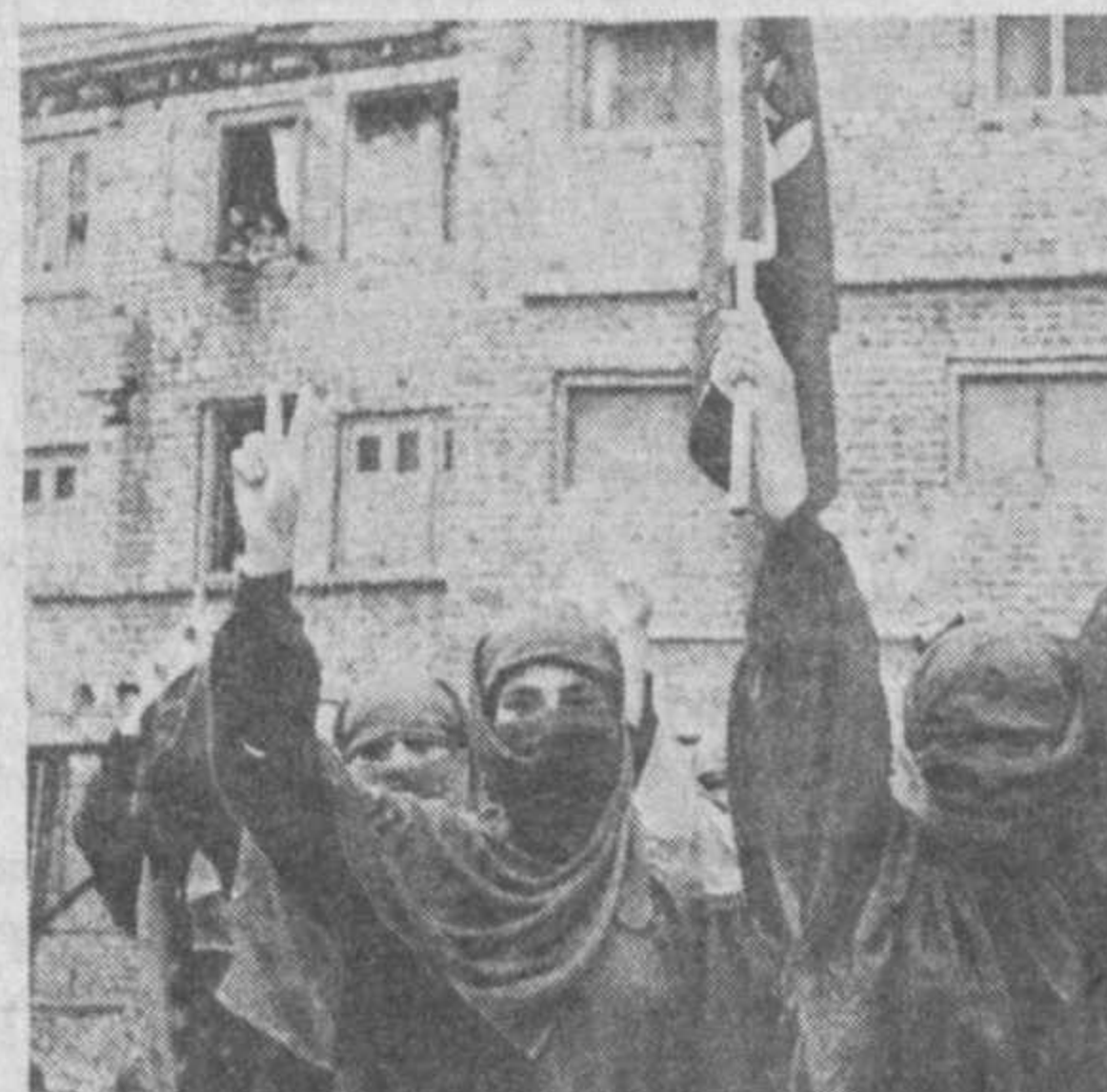
ИНДИЯ. В Кашмире за последние несколько лет созданы 2 крупные и несколько мелких женских мусульманских организаций. Их основная окраска — религиозно-сепаратистская с ориентацией на Пакистан. Фотокорреспондент ТАСС.

НЬЮ-ЙОРК. По мере того, как перспектива войны в районе Персидского залива становится все более реальной, большинство американцев склоняется в пользу мирного урегулирования конфликта. Такой вывод можно сделать на основании результатов общенационального опроса общественного мнения. В ходе опроса 44 проц. его участников заявили, что Соединенные Штаты должны начать войну против Ирака, если тот не выведет свои войска из Кувейта к 15 января — крайнему сроку, установленному ООН. Однако 50 проц. полагают, что необходимо проявить терпение, дав больше времени для того, чтобы экономические санкции, введенные против Ирака, принесли существенные результаты. В исследовании указывается, что наибольшая доля сторонников решительных действий — 55 проц. — принадлежит к мужскому населению США в целом.