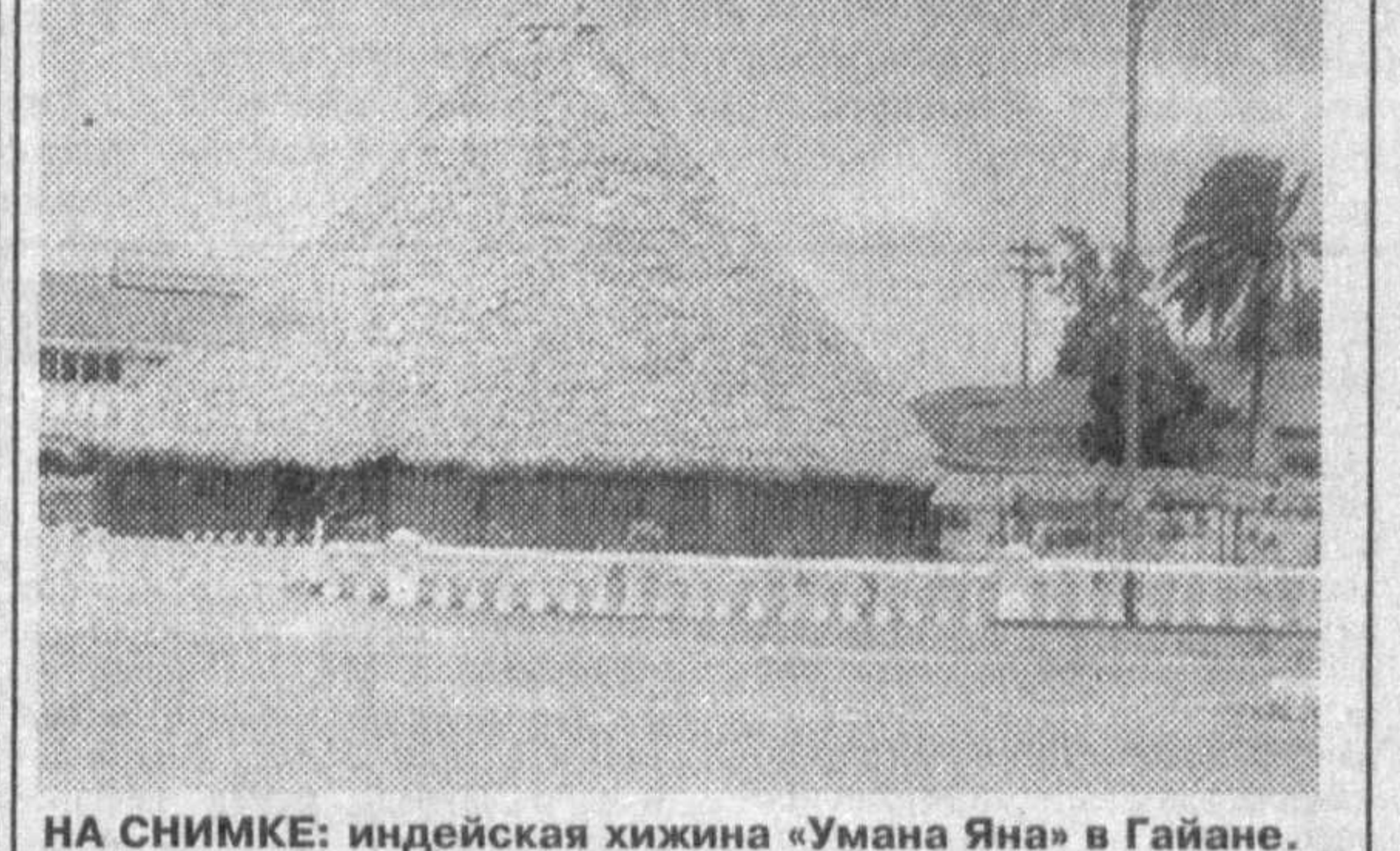
НА СНИМКЕ: индийская хижина «Умана Яна» в Гайане.