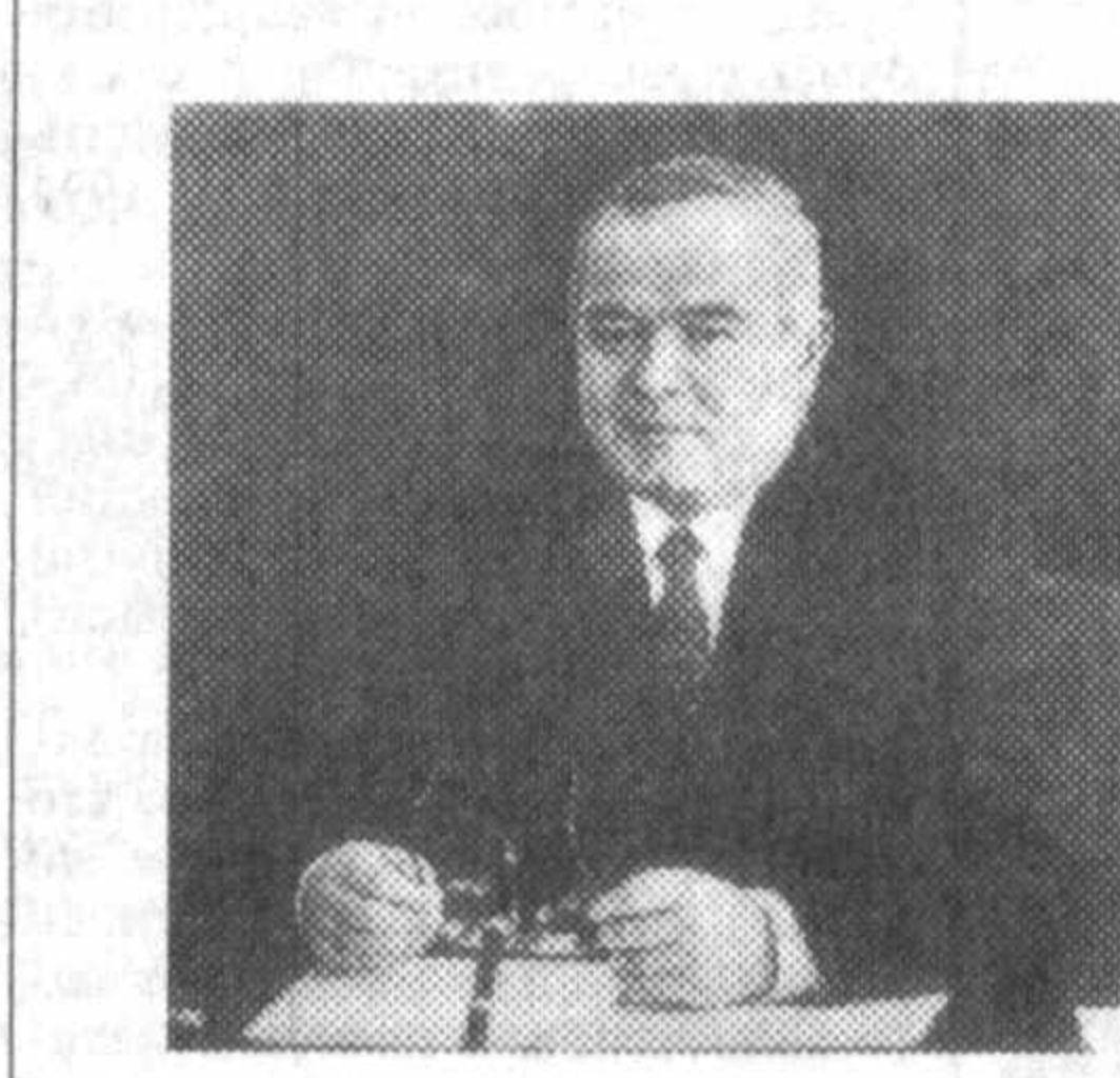
Islam Karimov, Président de la République de l'Ouzbékistan

Подтверждением тому является издание в Париже на французском языке книги Президента нашей республики Ислама Каримова «Узбекистан по пути углубления экономических реформ».