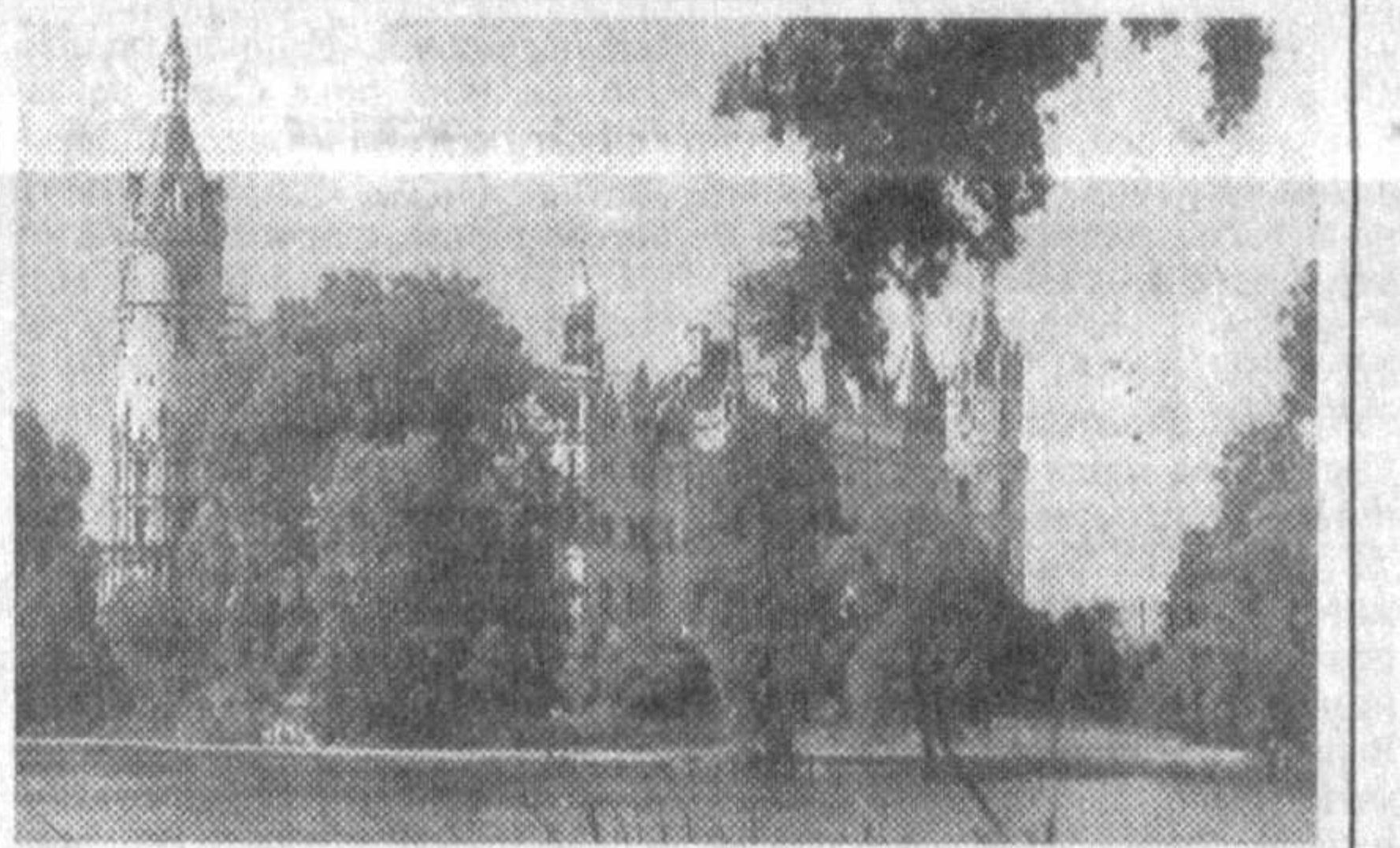
НА СНИМКЕ: городской дворец в Шверте (Германия).