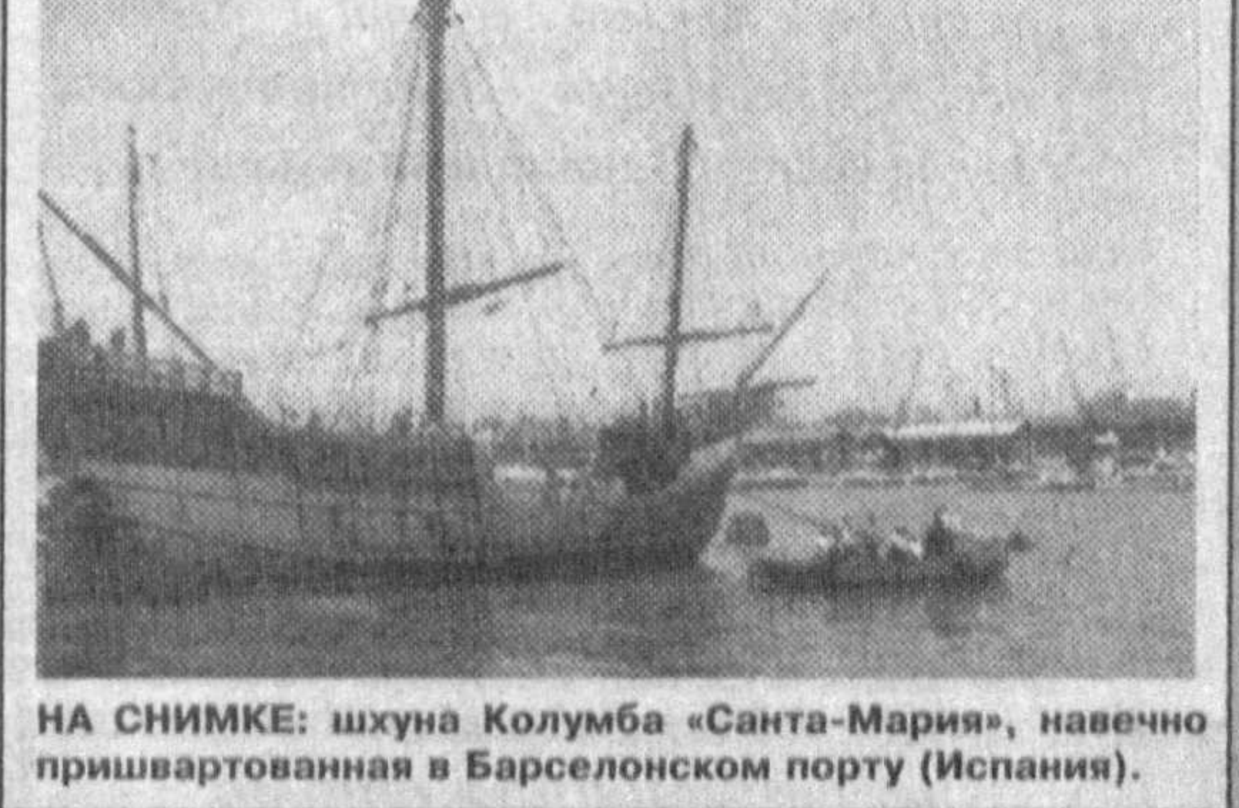
НА СНИМКЕ: шхуна Колумба «Санта-Мария», напемно пришвартованная в Барселонском порту (Испания).