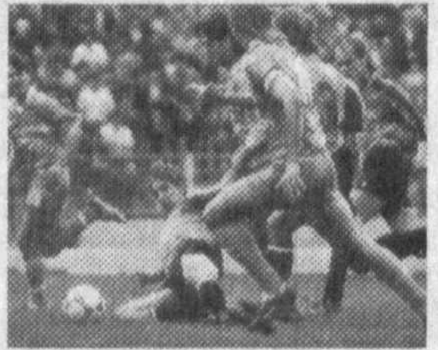
«Дустлик» — «Машгаль» «Навбахор» — МХСК

КАЛЕНДАРЬ ИГР ВЫСШЕЙ ЛИГЫ Первый круг 1-й тур 20 апреля (суббота) «Атласчи» — «Нефтчи» «Нурафшон» — «Машгаль» 2-й тур 24 апреля (среда) «Нефтчи» — «Согдиана» «Наврзу» — АСК «Динамо» (С) — «Касансай» «Трактор» — «Пахтакор» «Янгир» — «Навбахор» «Машгаль» — «Динамо» (У) 25 апреля (четверг) МХСК — «Дустлик» «Атласчи» — «Нурафшон» 3-й тур 28 апреля (воскресенье) АСК — «Динамо» (С) «Согдиана» — «Наврзу» «Пахтакор» — «Янгир» «Касансай» — «Трактор» «Динамо» (У) — «Дустлик» «Нурафшон» — «Нефтчи» «Динамо» (У) — «Атласчи»