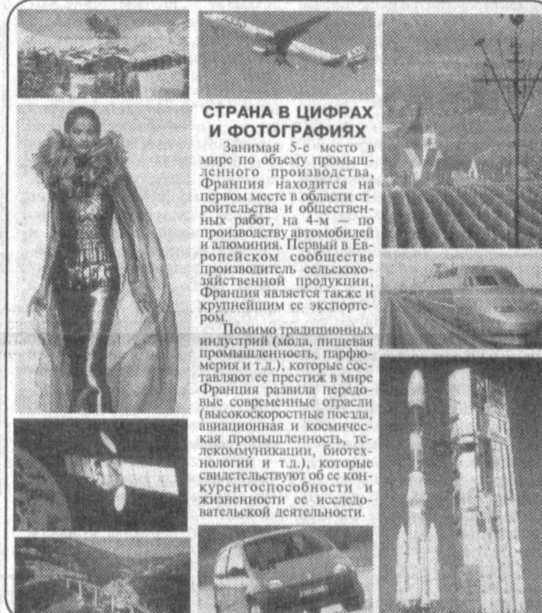
СТРАНА В ЦИФРАХ И ФОТОГРАФИЯХ

Указом Президента Республики Узбекистан за выдающиеся заслуги в укреплении культурного сотрудничества между ЮНЕСКО и Узбекистаном, огромный вклад в возрождение и распространение богатейшего наследия народов Центральной Азии генеральный директор Организации Объединенных Наций по вопросам образования, науки и культуры, бывший ученый и общественный деятель Феридун Мамор награжден орденом «Душанки», а видный ученый французского происхождения профессор Л. Керри за многочисленные плодотворные научные исследования жизни и деятельности Амира Темурида, его вклад в дело сближения культур и взаимопонимания народов Франции и Узбекистана награжден медалью «Шухрат».