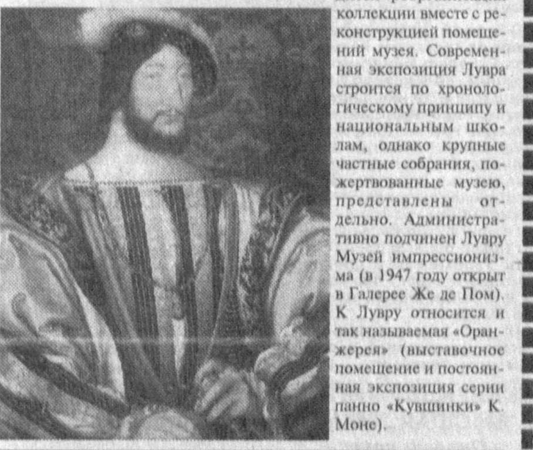
Материалы подготовлены совместно с информационным агентством «Сажон» при МИД Республики Узбекистан и изданием «Label France».

рембрандта и мн. др. С 1931 года широко проводятся реорганизация коллекций вместе с реконструкцией помещений музея. Современная экспозиция Лувра строится по хронологическому принципу и национальным школам, однако крупные частные собрания, пожертвованные музею, представлены отдельно. Административно подчинен Лувру Музей импрессионизма (в Галерее Ж де Омюр) и Лувр относится к так называемой «Оранжевой» (выставочное помещение и постоянная экспозиция серии живописи «Кувшинки» К. Моне).