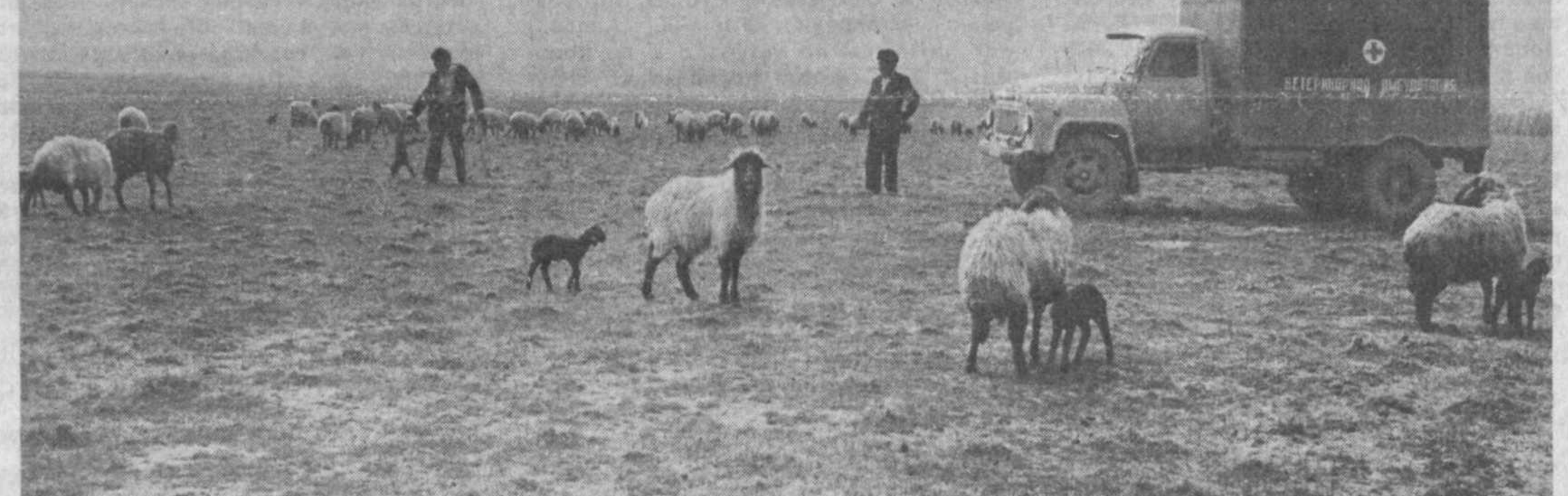
Окотились первые овцематки в совхозе «Кызылча» Бухарской области. Работные хлопоты наступили у чабанов. Принять, сбе-

Р. ИБРАГИМОВ, сотрудник Госкомприроды УзССР.