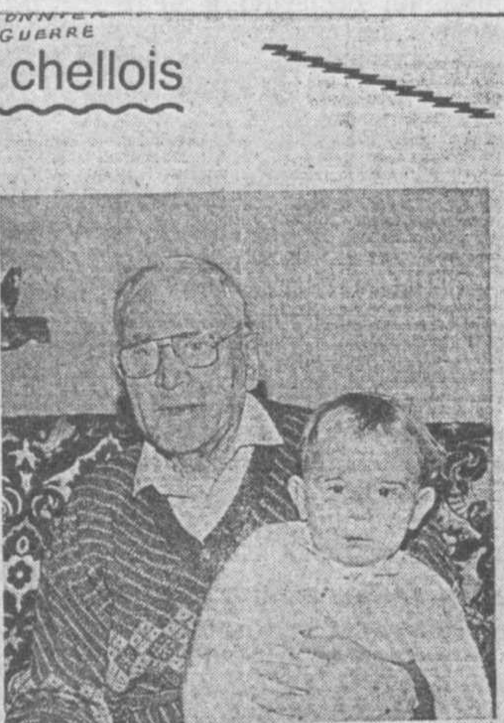
Une belle histoire recueillie par Yves CHABOT (Voir en page 14.)

Поймав в темноте петуха, зарубили его, ошпарили, выпотрошили, бросили в казан. К этому времени подошел и Хусайн-Хамза с кувшином вина. При виде вина у гонцов от радости рты раскрылись до ушей. Вскоре и еда подоспела. — После еды они будут отдыхать, спать, ведь с рассветом их ждет доро-