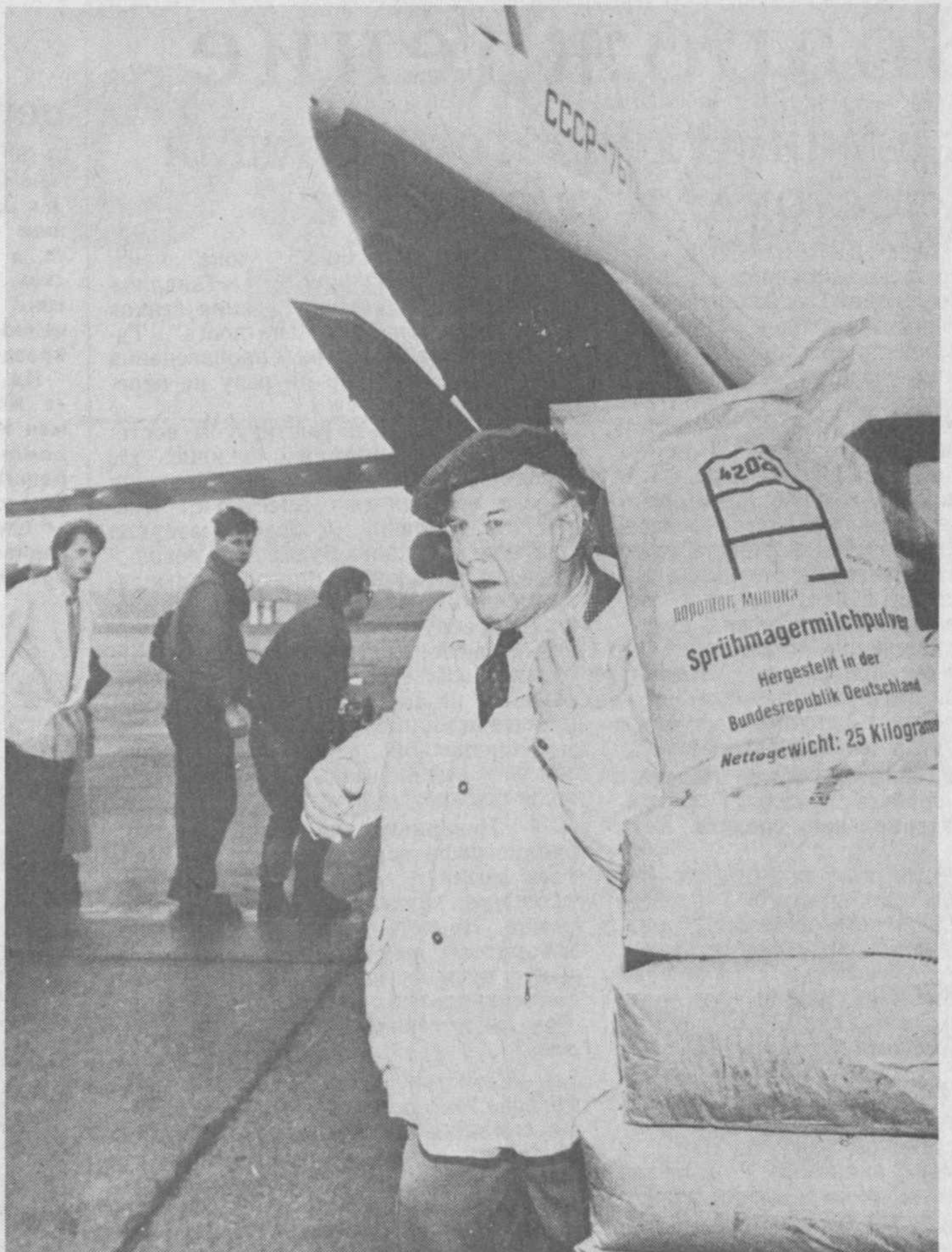
Широкомасштабная акция по оказанию гуманитарной помощи Советскому Союзу проходит в ФРГ. Снимок сделан на аэродроме в Кельне во время погрузки продовольствия на борт советского самолета, вылетающего в Минск. Собранным здесь следует оказать содействие в работе известного английского актера Питера Устинова.