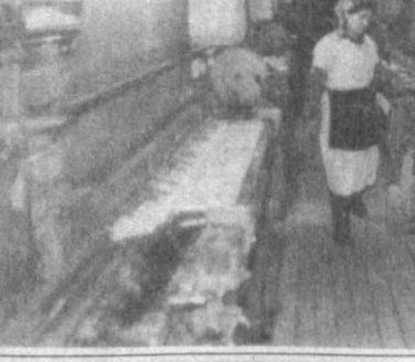
стильщики из кишлака Ойим планируют отправить потребителю 420.000 квадратных метров полотенечной ткани...

"Бунед-М" специализируется в основном на выпуске махровых полотенеч. Сейчас здесь налажено производство трех видов пряжи и пяти - полотенечной ткани.