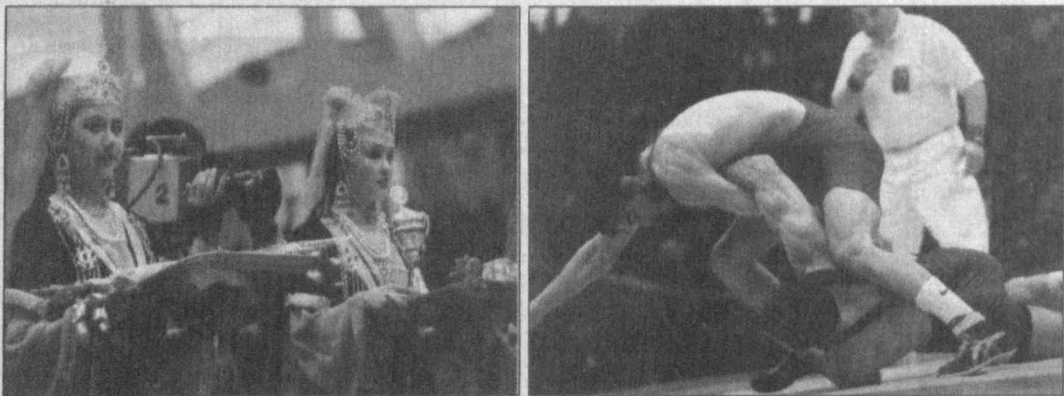
Радости ташкентским болельщикам доставило и выступление их земляков...

Как один феерический миг пролетели три дня III Кубка независимости, очень символично совпавшего с исконно народным праздником - Наурузом.