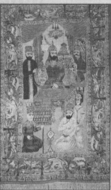
НА СНИМКАХ: обложка журнала “SAN'AT” №1, 1999; ковер (из частной коллекции) с изображением Амира Темура, восседающего на троне.