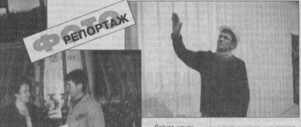
Сейчас немецкие инженеры одновременно с пусконаладочными работами ведут обучение тех, кому предстоит здесь трудиться.

Остаются считанные дни до сдачи в строй первой линии совместного узбекско-германского предприятия "Каолин".