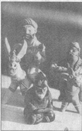
усто, так и молодые, одаренные художники. Ведь не зря говорят: бессмертие учителя в его учениках.

Чтобы не растерять, а еще более обогатить веками накопленный опыт уникального национального ремесла, в Самарканде создано новое объединение — "Хунарманда". Здесь созданы произведения декоративно-прикладного искусства 580 народных умельцев — как именитые, признанные