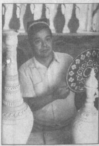
Талантливо выполненные изделия самаркандских усто

Но только то дорого, что красно золото, а то, что доброго мастерства, — гласит народная мудрость.