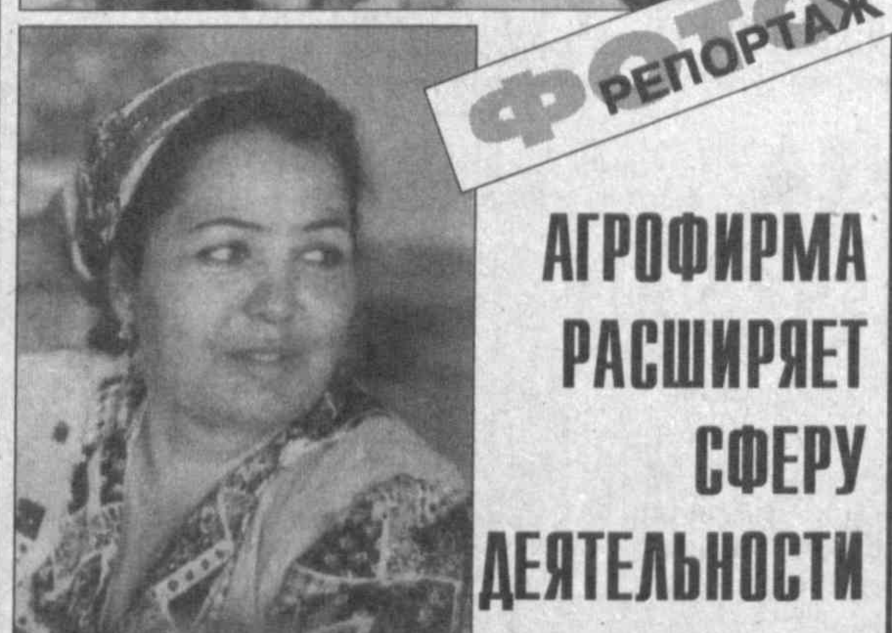
Действующая в Зарбдарском районе частная агрофирма "Шахзод" уже с первых лет своего существования заявила о себе как хозяйство образовое...