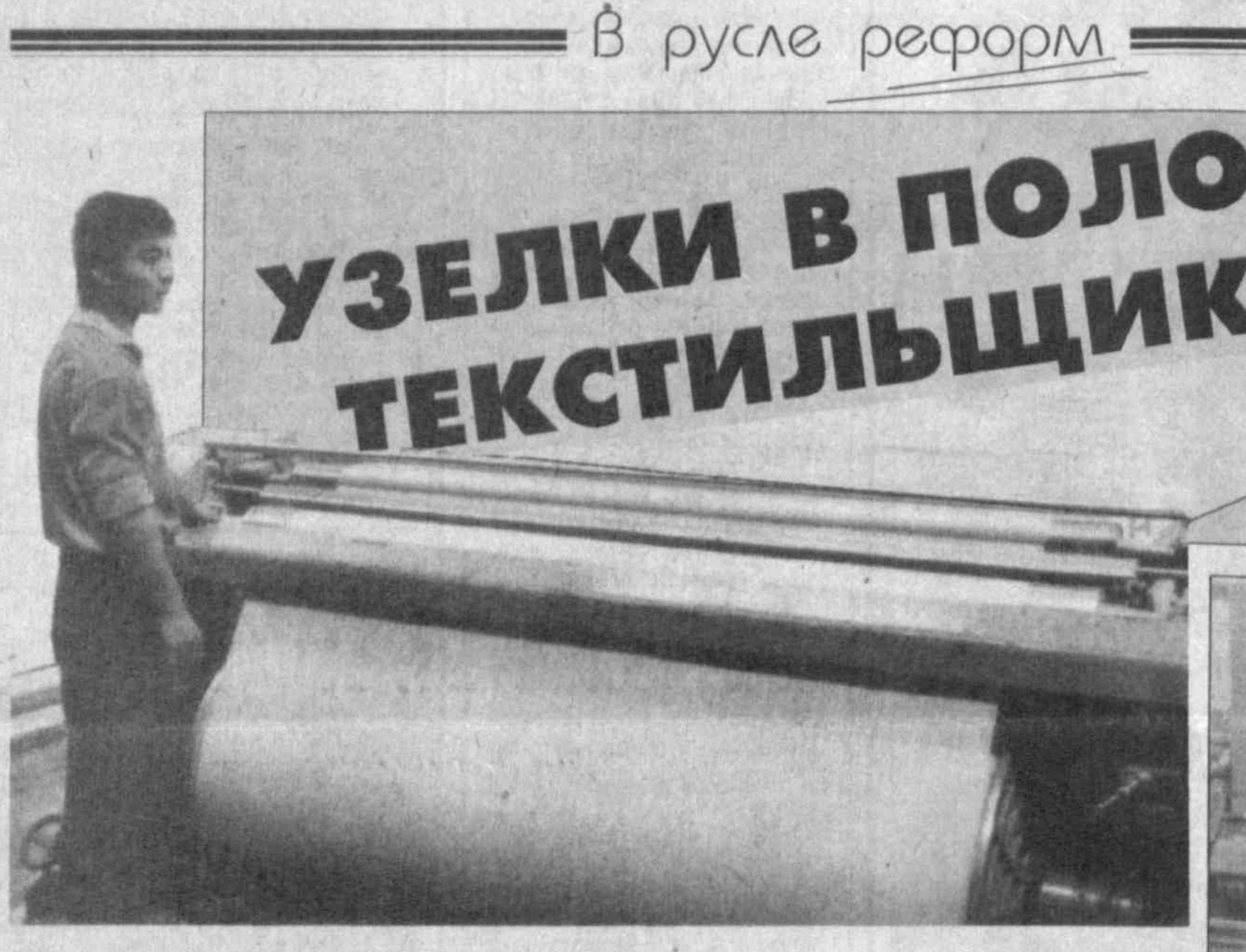
Когда-то, в далеком 1932-м, был положен первый кирпич в основание будущего Ташкентского текстильного комбината. С тех пор утекло немало воды...