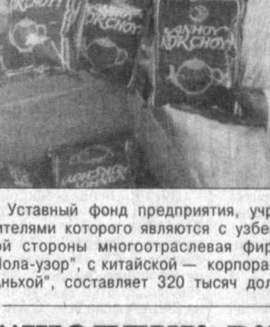
ЧАЙ ОТ "АЛ-ЖАХОН"

Всего несколько месяцев назад в Уйчирском районе начало функционировать совместное узбекско-китайское предприятие "Ал-Жахон". Несмотря на столь "юный" возраст, СП успешно завоевывает популярность среди местных жителей.