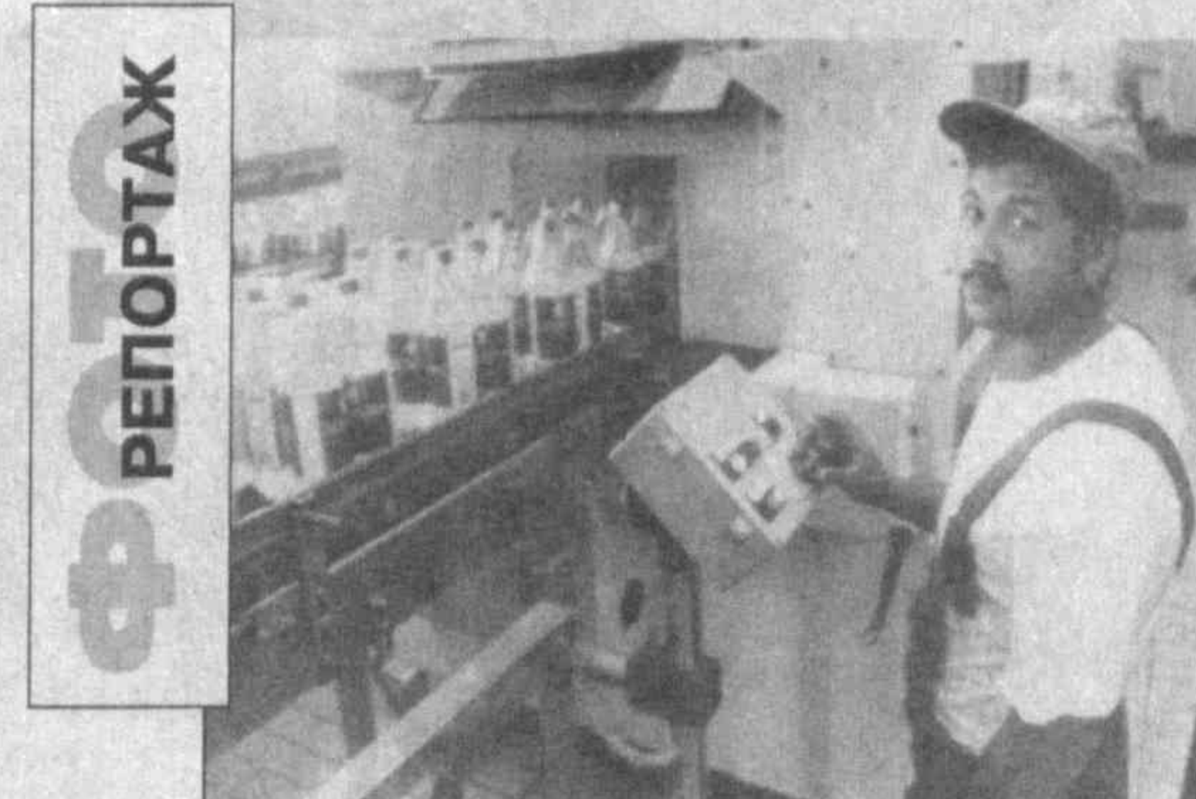
Меньше года, как открылось в Ургенте совместное узбекско-американское предприятие "Кока-кола ичимлиги". И несмотря на то, что в шахт молодого предприятия, оснащенного новейшим оборудованием, ежедневно выпускается до 40 тысяч упаковок продукции, "рейтинг" напиток не падает.

Ведь пшос к приятным вкусовым качествам кока-кола еще и целебна. Производственное оборудование французской фирмы "Сидель" по очистке воды позволяет изготавливать экологически чистый продукт.