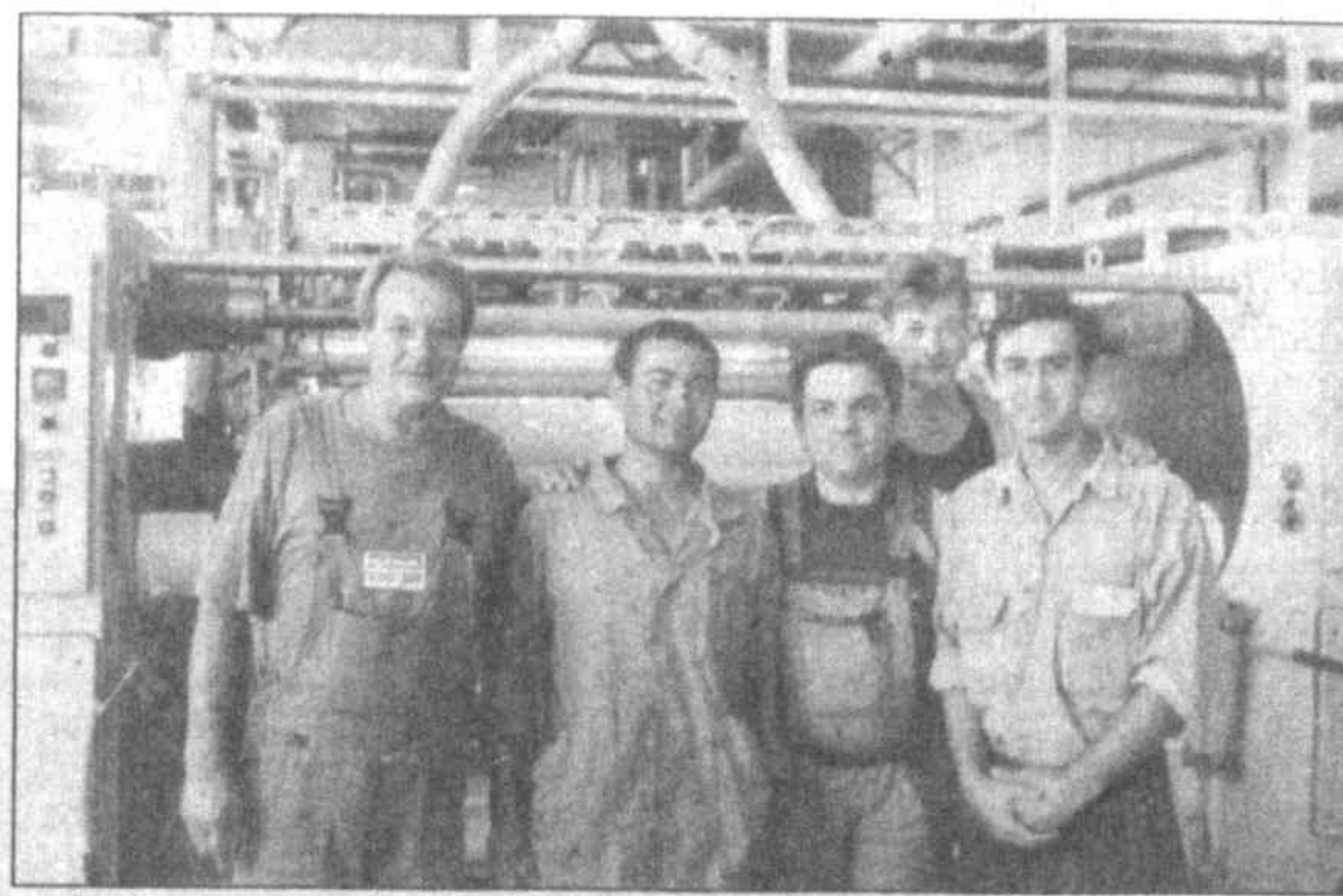
Первая партия новой продукции выйдут из ворот завода...

Так говорят сегодня труженики ахангаранского АО "Стройпластмасс" в двух цехах которого уже завер-