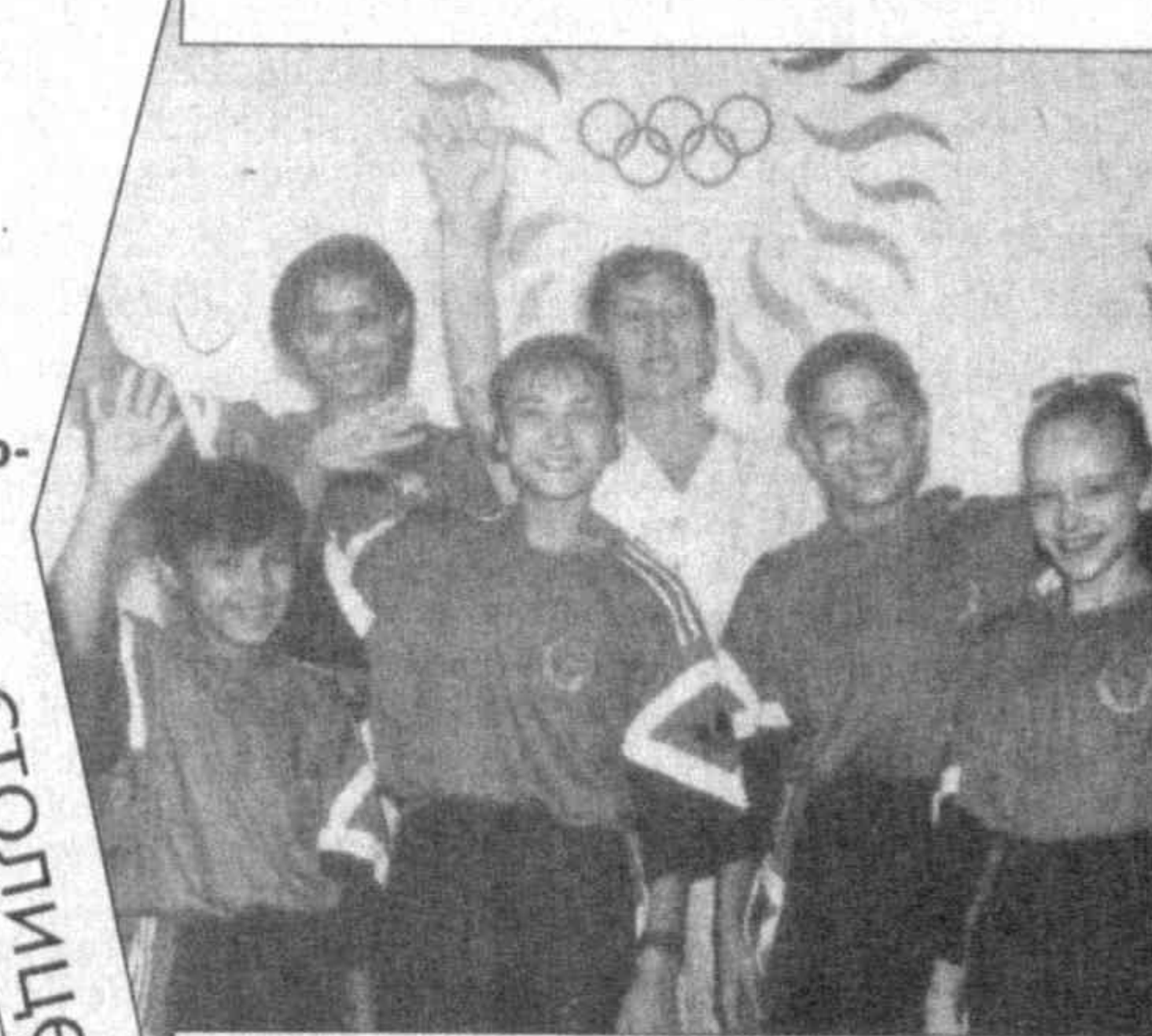
не Сиднея-2000, то уж точно Афин-2004, не победы, а то, что спорт в очередной раз сблизит, сдружит молодежь планеты, что в мире станет больше друзей. Ну а то, что Родина будет болеть и переживать за своих посланцев, юноши и девушки поняли на теплой прошальной встрече в Музее олимпийской славы. Где среди экспонатов, отражающих достижения их предшественников, обязательно найдется место для экспозиции, посвященной их участию в Московских играх.

Почти 8.000 спортсменов выступят в соревнованиях I Всемирных юношеских игр по 15 видам спорта. И мы верим, что узбекистанцы, удостоившись награды в десяти видах программы, не останутся в тени, сделают все, чтобы флаг страны гордо ревел над спортивными аренами Москвы. Но главное в этих играх, которые, безусловно, выведут многих юных атлетов на большие олимпийские орбиты если