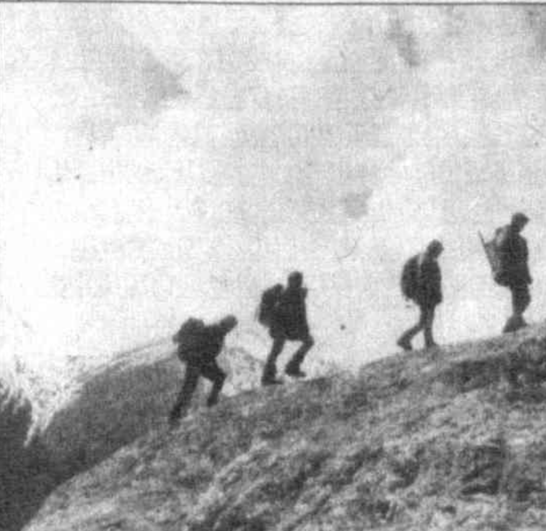
Укрепить здоровье, набраться сил, энергии и незабываемых впечатлений в 20 ведомственных спортивно-оздоровительных лагерях смогут около 18 тысяч мальчишек и девочек.