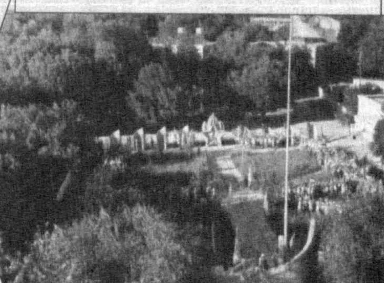
пансионате. Многие из них бывают здесь по путевке каждое лето, а кто приехал впервые особо радостно воспринимают прелести летнего досуга. Это и бассейны, и прохлады скверов, и походы в древние пещеры, и наскальные рисунки ущелья Сармыш, и родниковые разливы под названием "эмирские ванны", и веселые старты, и внутренняя пансионатская "валюта" — сармышки, — которую зарабатывают дети за участие в соревнованиях и концертах.