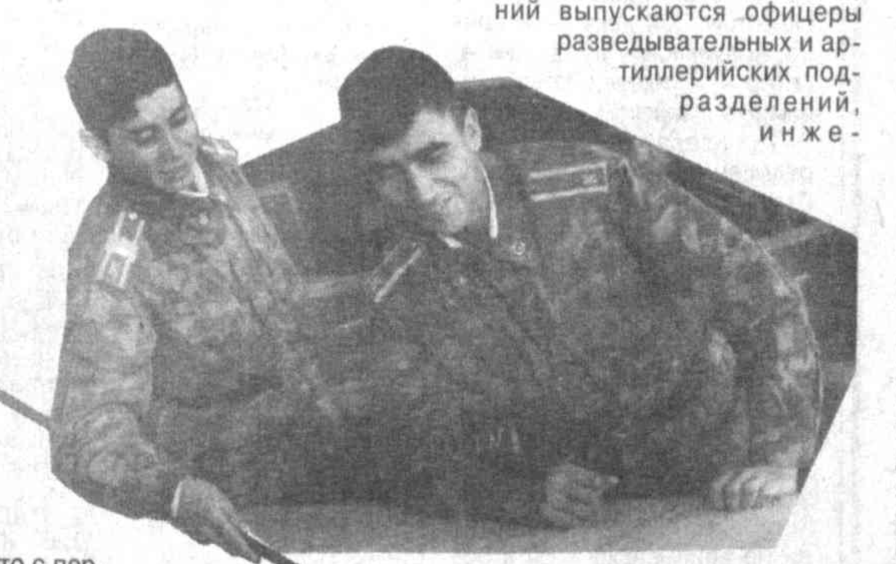
что с первых дней своего существования здесь готовились военные кадры и из представителей местных, коренных национальностей...