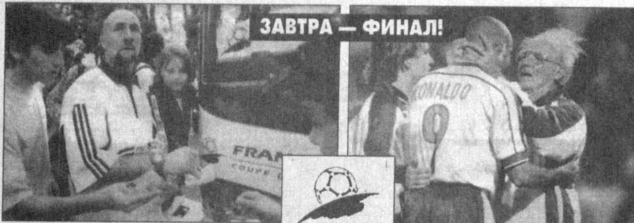
ЗАВТРА — ФИНАЛ!