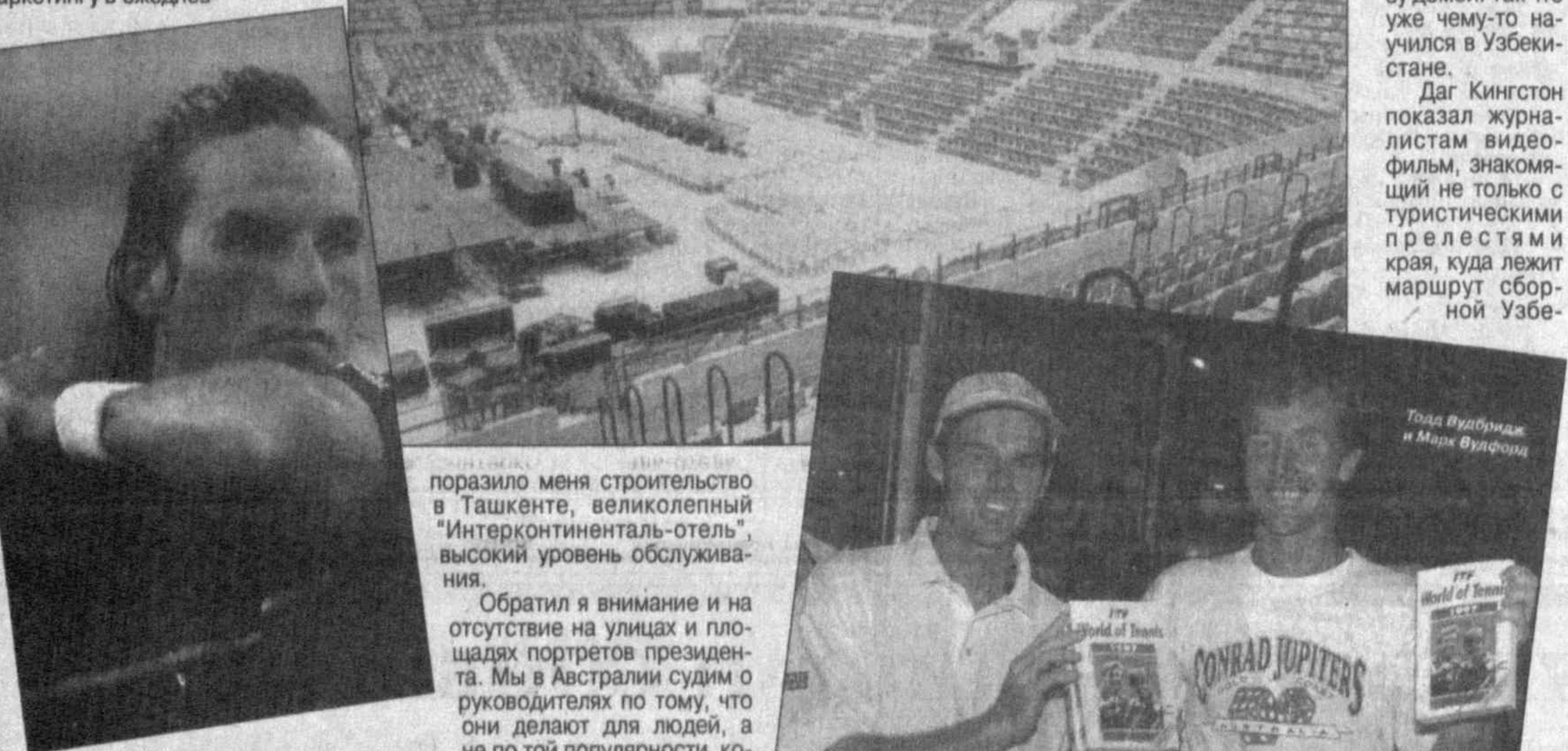
Парадиз меня строительство в Ташкенте, великокопный "Интерконтиненталь-отель"...