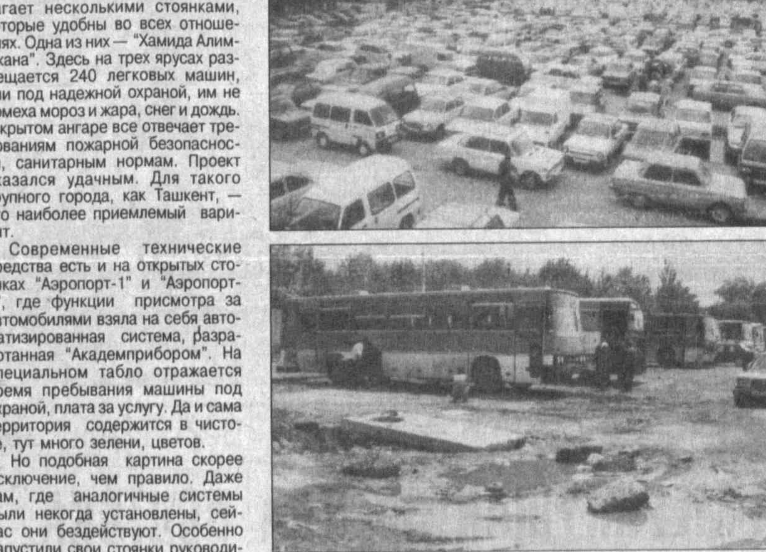
НА ШИМКАХ: тесно стоящим машинам; эта автостоянка отнюдь не украшает столицу.