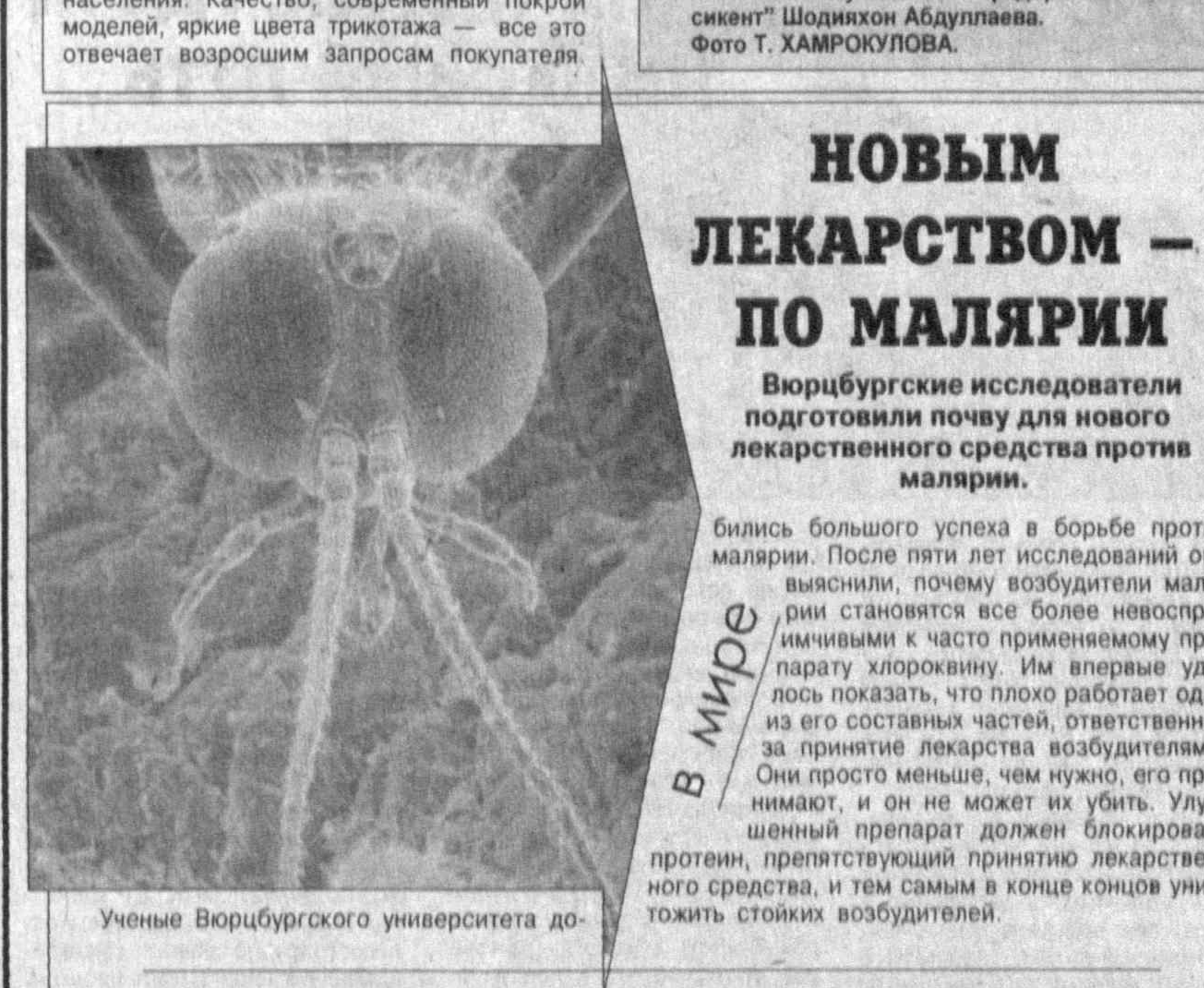
Ученые Вюрцбургского университета до-