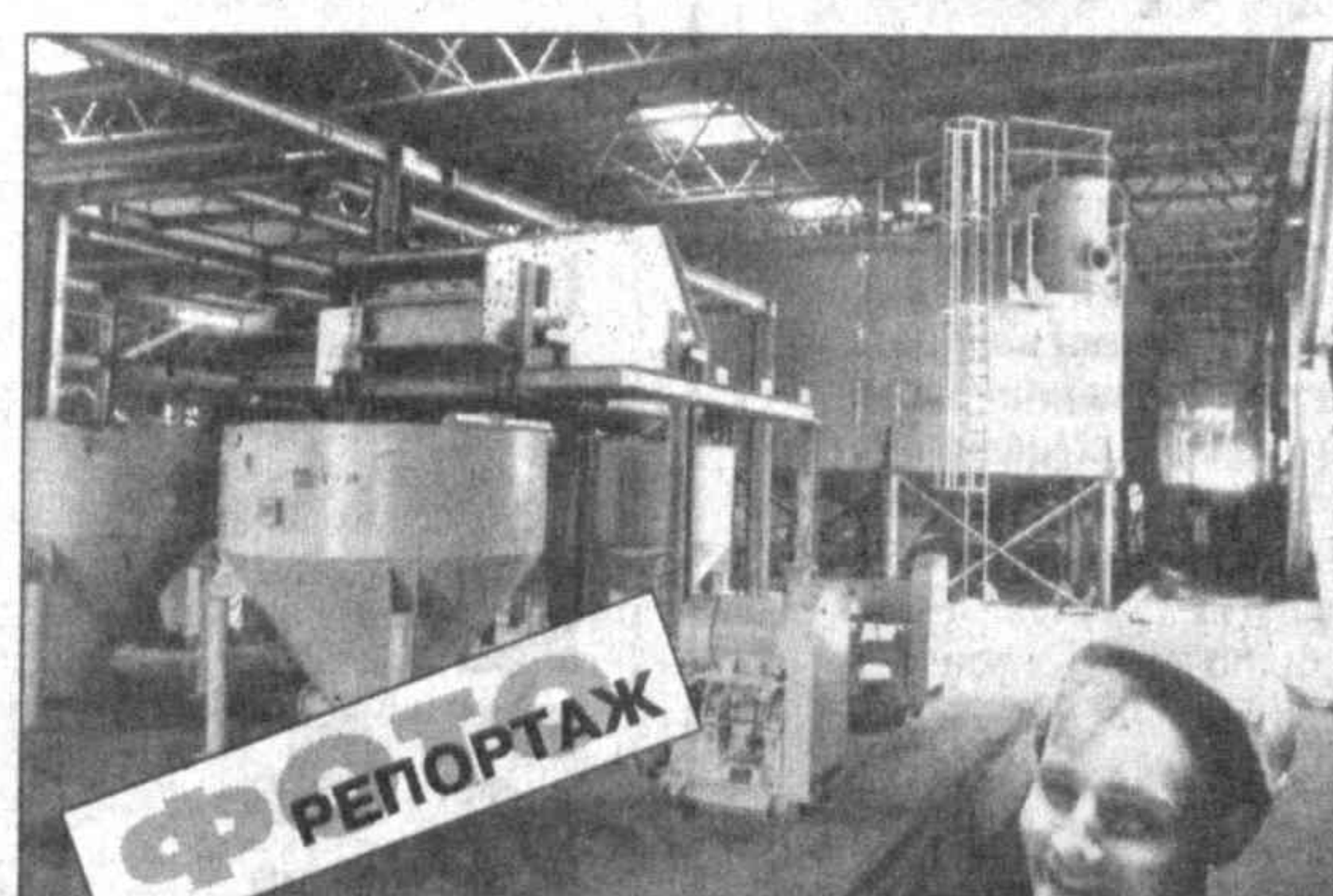
В небольшом городе Ташкентской области — Ангрене ведется одна из важнейших строек для экономики Узбекистана. А будет совместное германско-узбекское предприятие по производству каолина, которое и даст название СП — "Каолин".

Председатель Кабинета Министров И. КАРИМОВ. город Ташкент, 23 июля 1998 года.