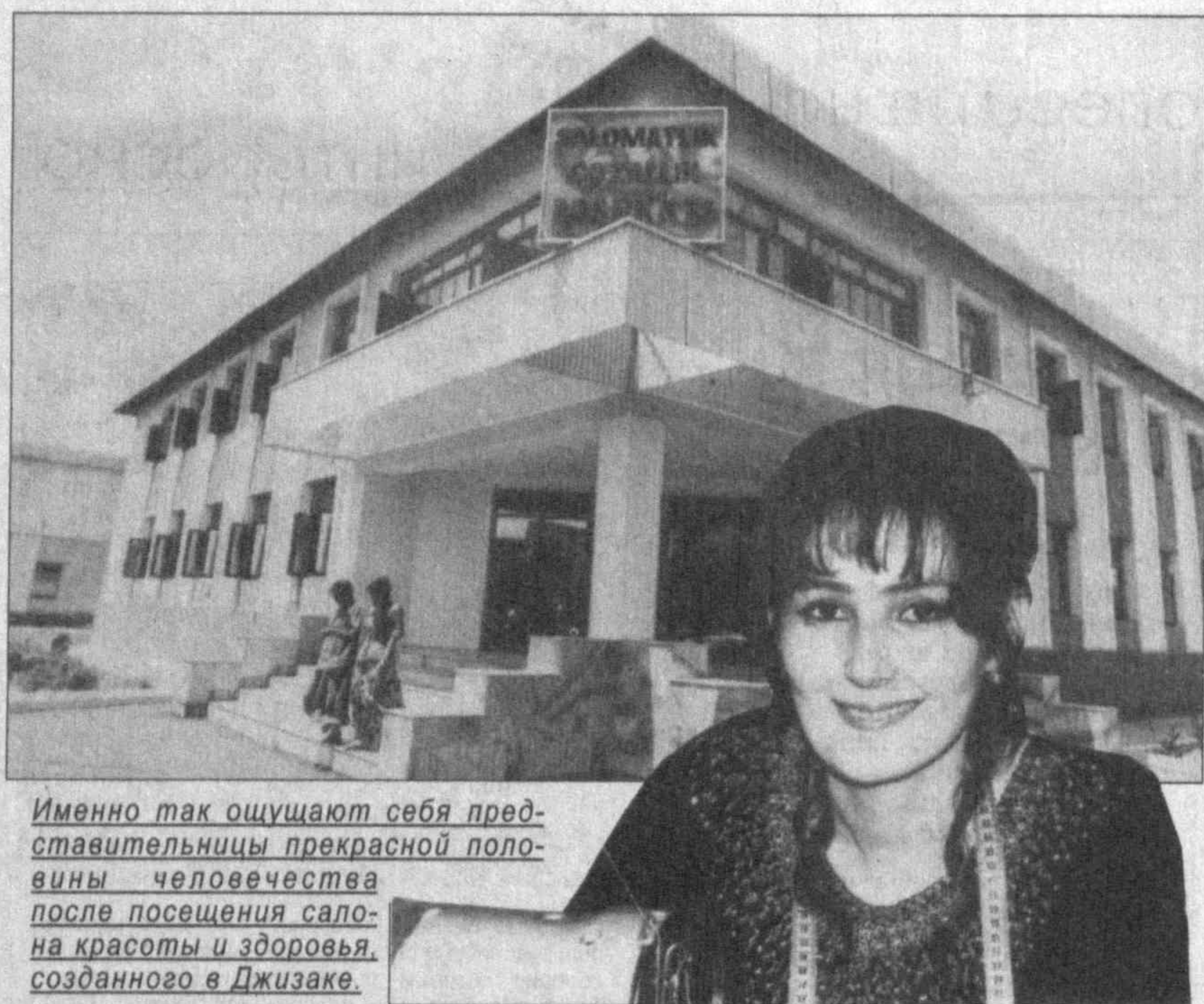
Именно так ощущают себя представительницы прекрасной половины человечества после посещения салона красоты и здоровья, созданного в Джизаке.