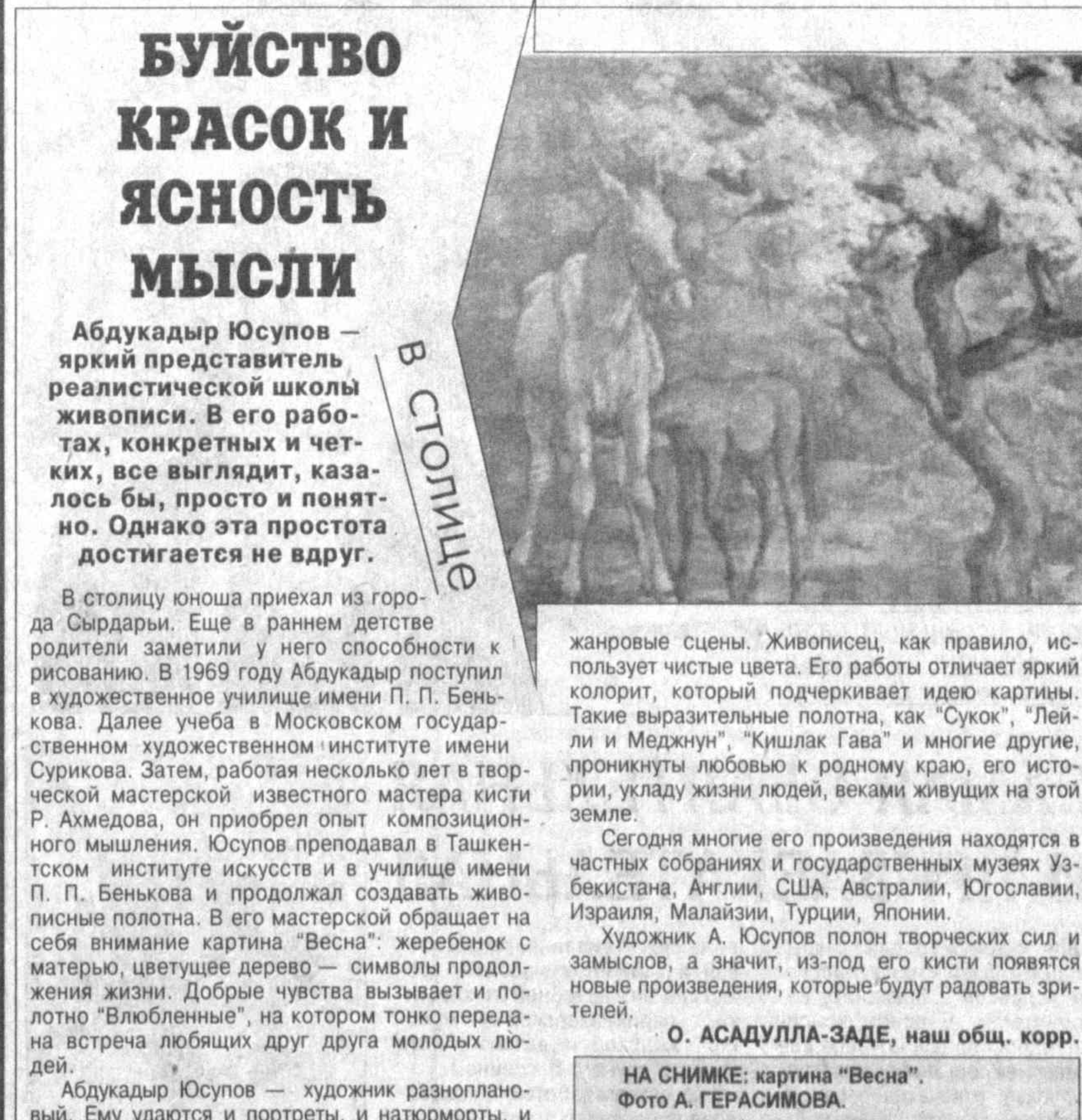
НА СНИМКЕ: картина «Весна».