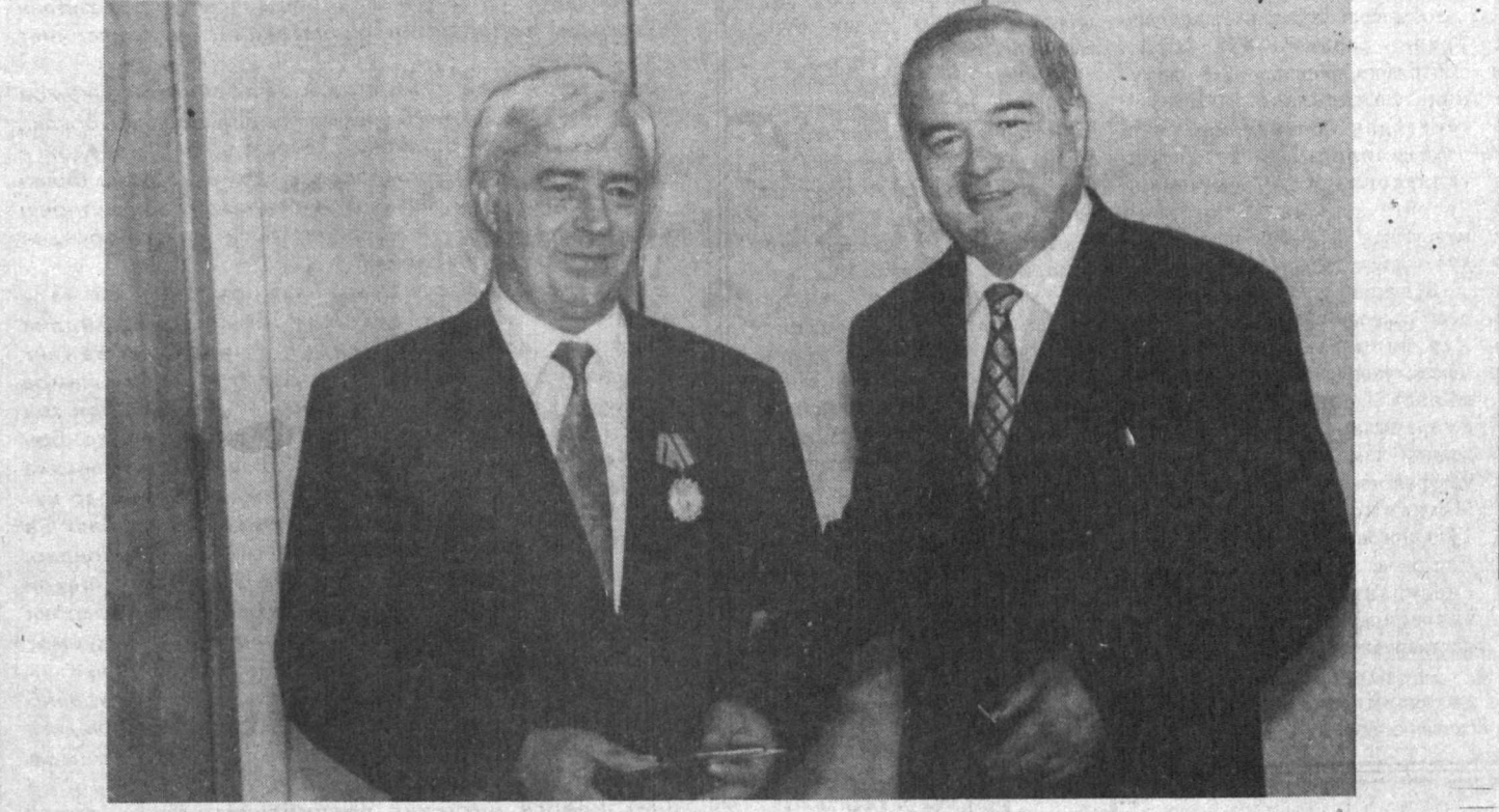
СУРАТДА: "Дўстлик" орденини тошшириш пайти.

қаратишимизда ердан береди. Шифокорларнинг ушбу анжумани тиббиёт ходимлари ҳамкорлигини кенгайтиришга, болалар орасида ичак, ўпка касалликлари ва юқумли касалликлар кўпайишига қарши курашда уларнинг биргаликда иштирок этишига кўмаклашмоғи лозим. Педиатрларнинг иттифоқи тузилгани ҳам бу ишда янги имкониятлар очади. Болалар касалликларини шифокорларнинг уюшмаси соф тиббий вазифаларини ҳал этишдан ташқари, халқларимиз ўртасидаги тинчлик ва тотувликни мустаҳкамлашга ердан бериш ҳам шубҳасиздир. Л. СТРУНИКОВА, ЎЗД мухбири.