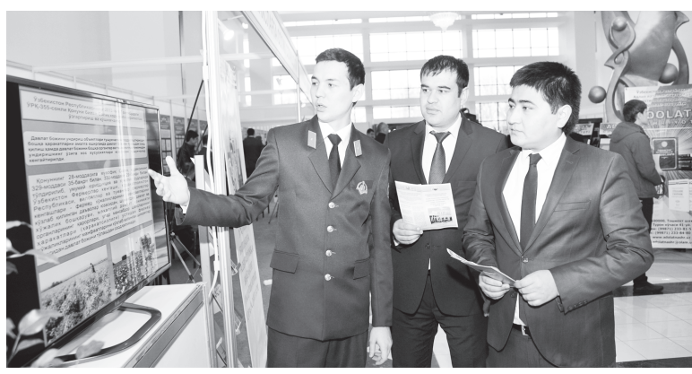
Хосенов ПАВЛОВЕВ олгон сурот.

жисмоний шахслар томонидан тураржойи ижарага беришда Тошкент шаҳрида 1 квадрат метр учун бир ойга 3 минг сўм, Нукус шаҳрида 2 минг сўм, бошқа аҳоли пунктларида эса бир минг сўм энг кам ижара ҳақи сифатида белгиланди. Нотуражойларни ижарага беришда ҳам шундай тартиб жорий этилиб, бу 1 квадрат метр учун Тошкент шаҳрида 6 минг сўм, Нукус шаҳри ва вилоятга бўйсунувчи шаҳарларда 4 минг сўм, бошқа аҳоли пунктларида 2 минг сўми ташкил этмоқда. Шу билан бирга, ижара ҳақининг