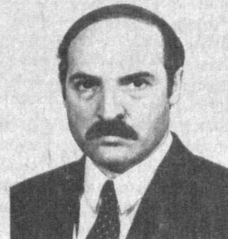
гилёв вилояти Шклов туманидаги «Ударник» жамоа

1954 йил 30 августда Могилёв вилоятида (Беларусь Республикаси) туғилган. Могилёв педагогика институтини тугатиб (1975 й.), тарих ва жамиятшунослик ўқувчиси мутахассислигини ва Беларуссия қишлоқ хўжалик академиясини тугатиб (1985 й.), агроносотиш ишлаб чиқариши соҳасида иқтисодчи мутахассислигини олган. 1982 йилдан бошлаб Мо-