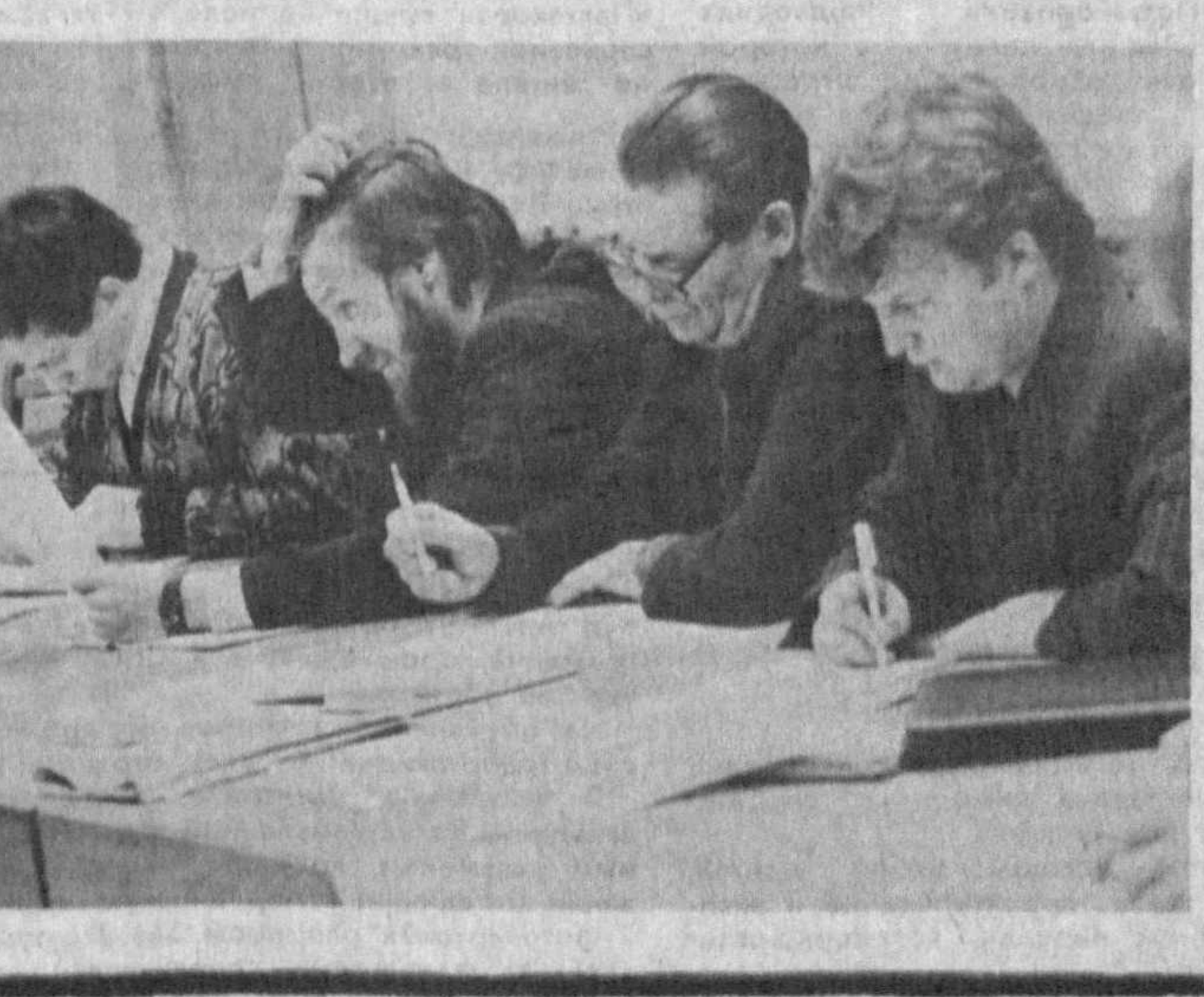
НА СНИМКЕ: учиться управляет — дело нелегкое.

Белорусская ССР. Открытием школы менеджеров начало свою деятельность в Минске малое учебно-научное предприятие «Прамень».