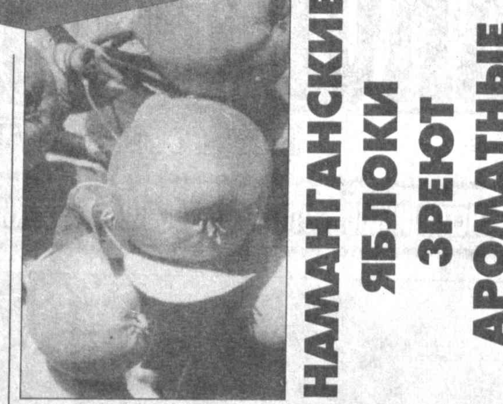
Дехкане специализированного хозяйства имени Бабура Чартакского района Наманганской области всегда помнят народную мудрость: "Что посеешь, то и пожнешь". Сегодня в полном разгаре сбор овощей и фруктов.

Сельские труженники намерены снять с 250 гектаров земли более трех тысяч тонн сочных яблок, ароматных груш, слив... Обеспечивают они горожан и отборной картошкой, янтарным виноградом. Получив экономическую свободу, чартакские садоводы научились работать слаженно. Хозяйство в числе первых в районе выполнило план по сбору зерна. Здесь постоянно идет поиск новых, более эффективных форм работы. Поэтому земля в знак благодарности одарила крестьян таким богатым урожаем.