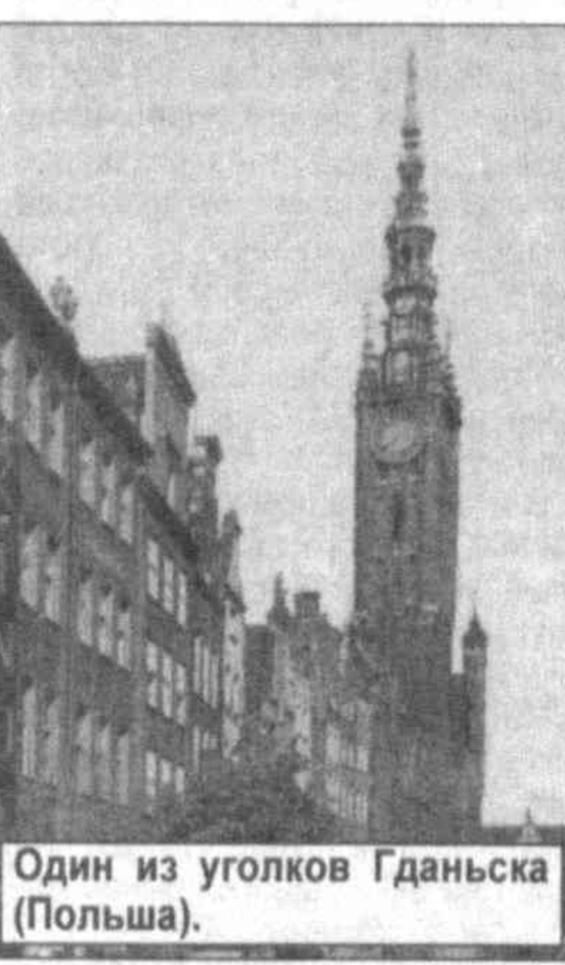
Один из уголков Гданьска (Польша).