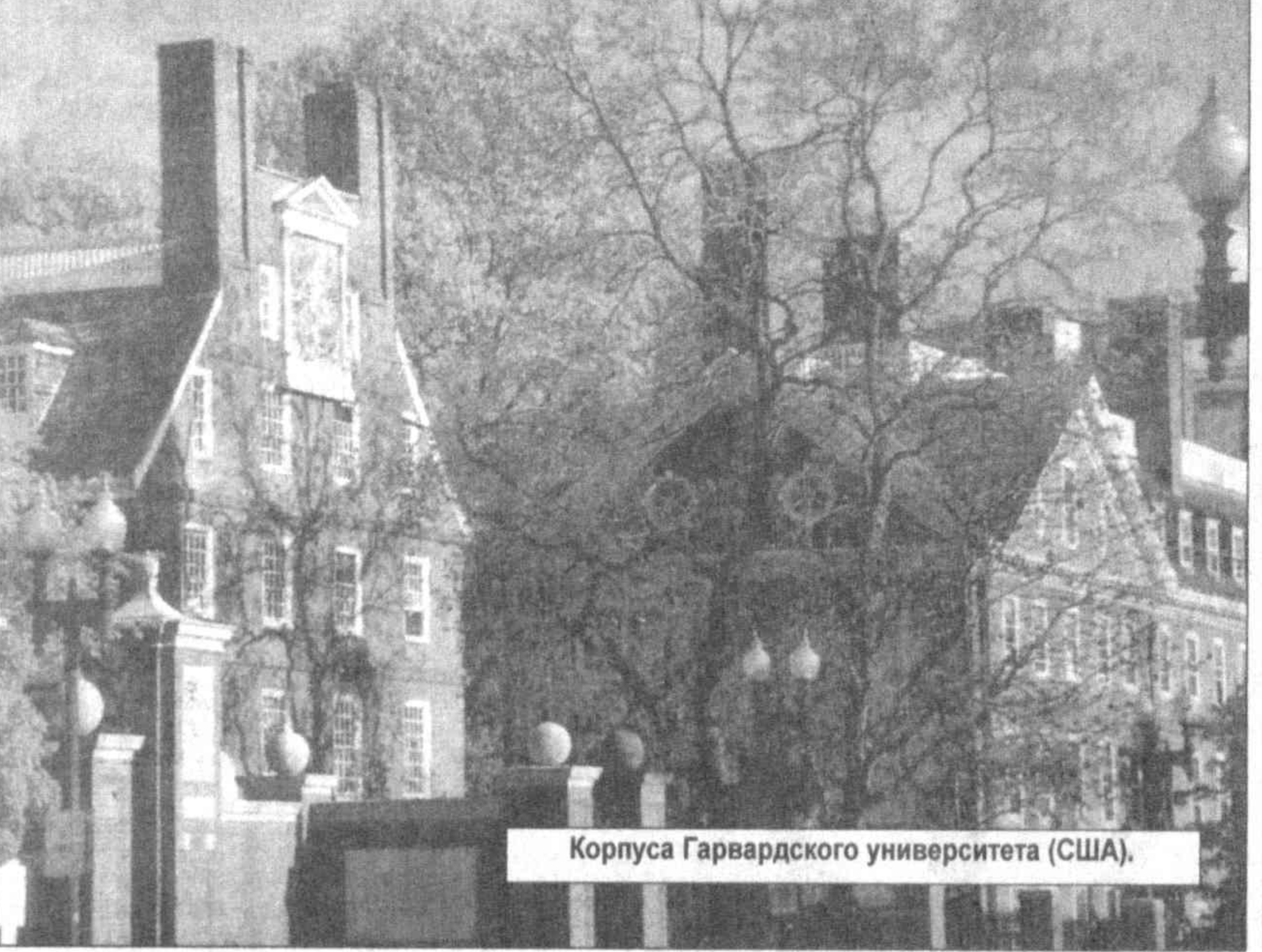
Корпуса Гарвардского университета (США).

Достижения науки и технологии неизменно отражаются на развитии всех областей человеческой деятельности. Именно поэтому поддержка и помощь развитию научных изысканий и технологий является неотъемлемой частью социальной политики. Программы развития науки и технологий, принятые ответственно в 1958 и 1983 годах, ярко демонстрируют стремление правительства всемерно способствовать развитию науки и технологий в таких областях, как здравоохранение, океанография, компьютерная техника и информатика, электроника, образование, фармакология и др. Сейчас правительство Индии рассматривает новую программу развития науки и технологий с учетом курса, взятого на либерализацию экономики, и необходимости достижения экономической самостоятельности и технологической конкурентоспособности.