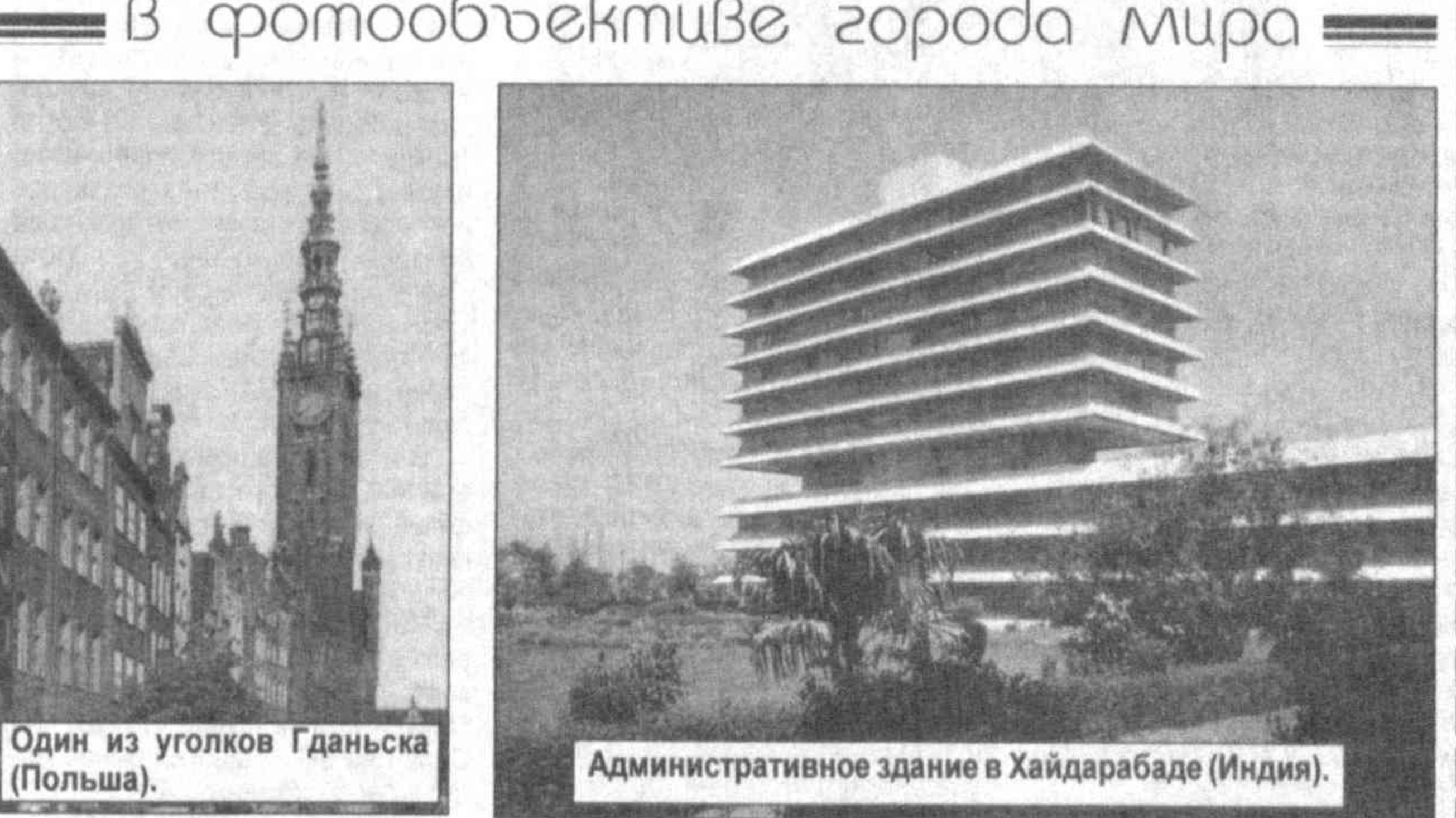
Административное здание в Хайдарабаде (Индия).