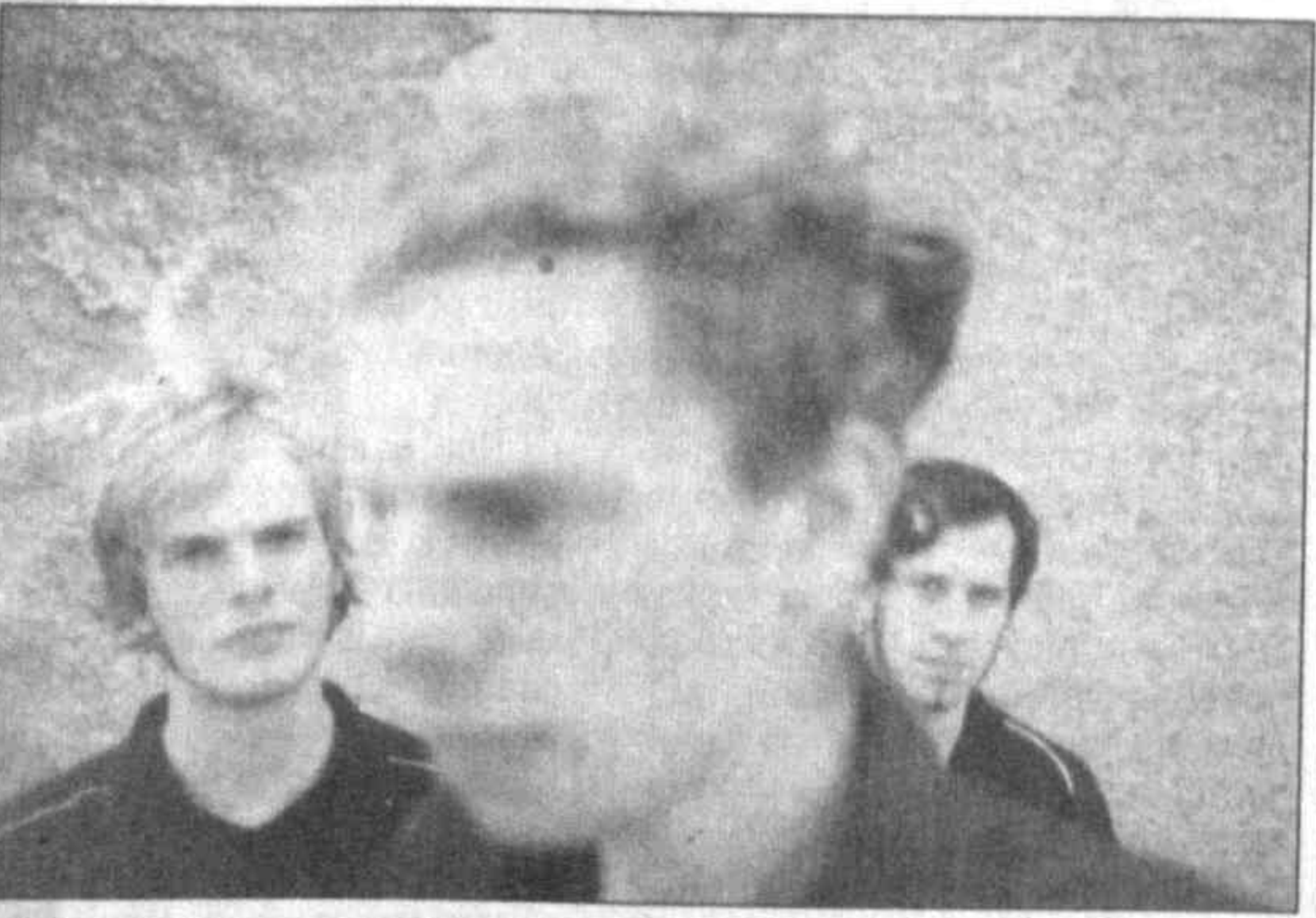
Идея проведения совместных концертов родилась в результате успешного выступления в Узбекистане популярной немецкой группы и заинтересованности молодежи в подобных гастрольных поездках.

О программе концертов германских рок-групп, которые будут проходить в рамках германо-узбекского фестиваля рок-музыки, шел разговор на пресс-конференции, состоявшейся по этому поводу в посольстве Германии в Узбекистане.