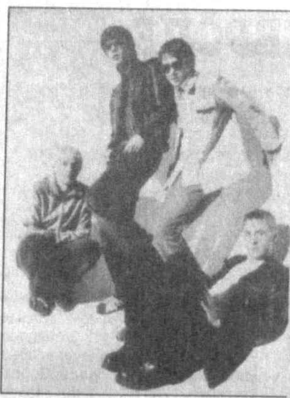
Идея проведения совместных концертов родилась в результате успешного выступления в Узбекистане популярной немецкой группы и заинтересованности молодежи в подобных гастрольных поездках.

М.ЗАХИДОВ, соб. корр. ИА “Жахон”, Токмо.