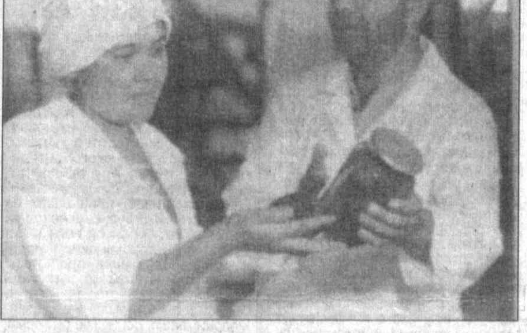
Беседу вел Б. НОРБОВЕВ, корр. УзА.